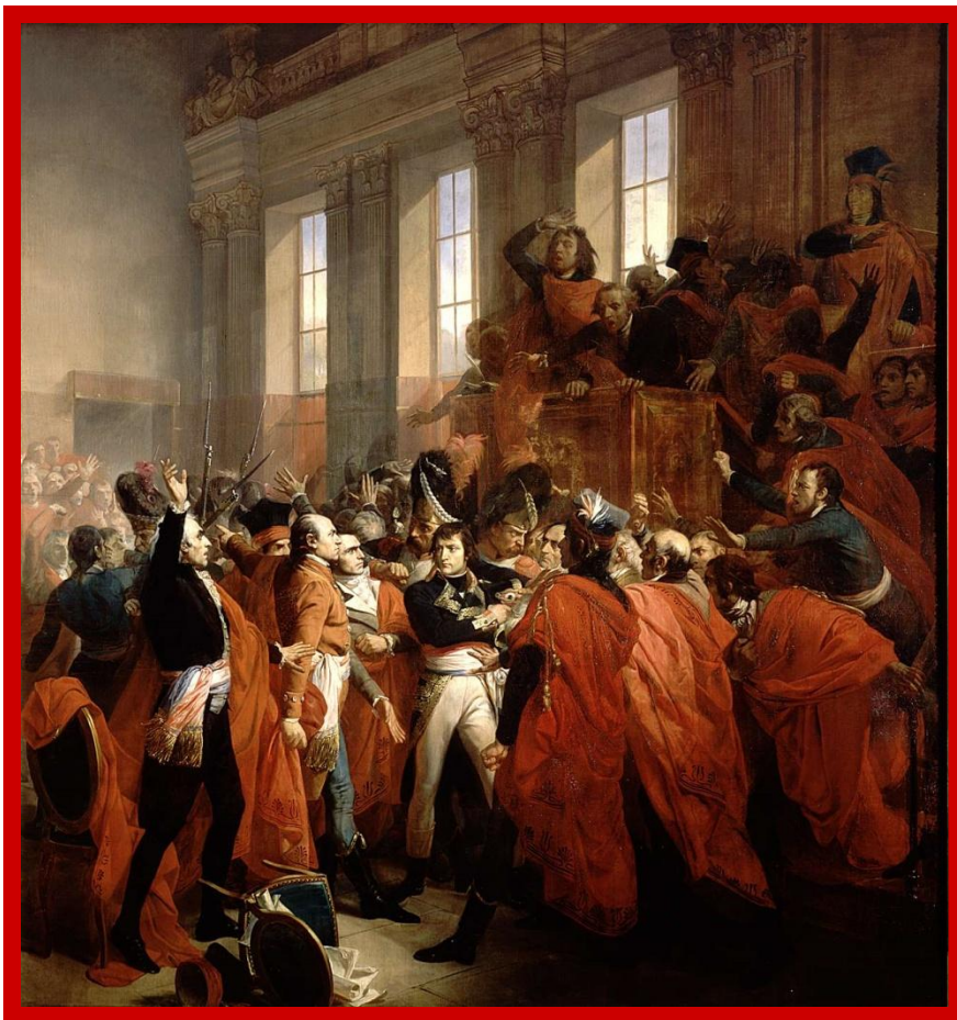
Государственный переворот 18—19 брюмера VIII года Республики

Однако конституция 1795 г. не смогла учредить во Франции устойчивой государственной власти, Директория постоянно лавировала между своими противниками — якобинцами и роялистами, попеременно привлекая на свою сторону то одних, то других. В конечном счете она окончательно себя скомпрометировала.