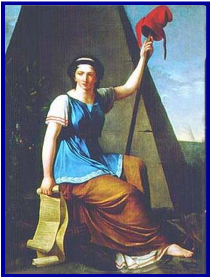
Великая французская революция. Конституция Франции