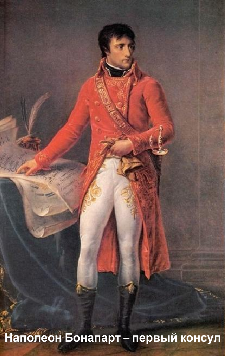
Наполеон Бонапарт – первый консул

9—10 ноября (18—19 брюмера VIII года Республики ) 1799 г. - государственный переворот - окончание Великой французской буржуазной революции.