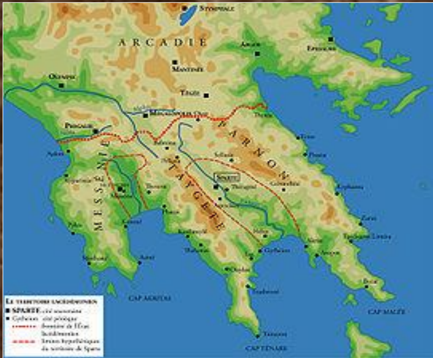
Территория Древней Спарты