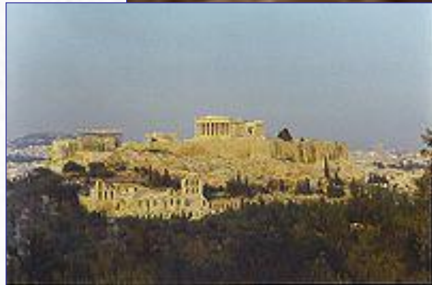
Акрополь в Афинах. 2-я половина 5 в. до н. э.