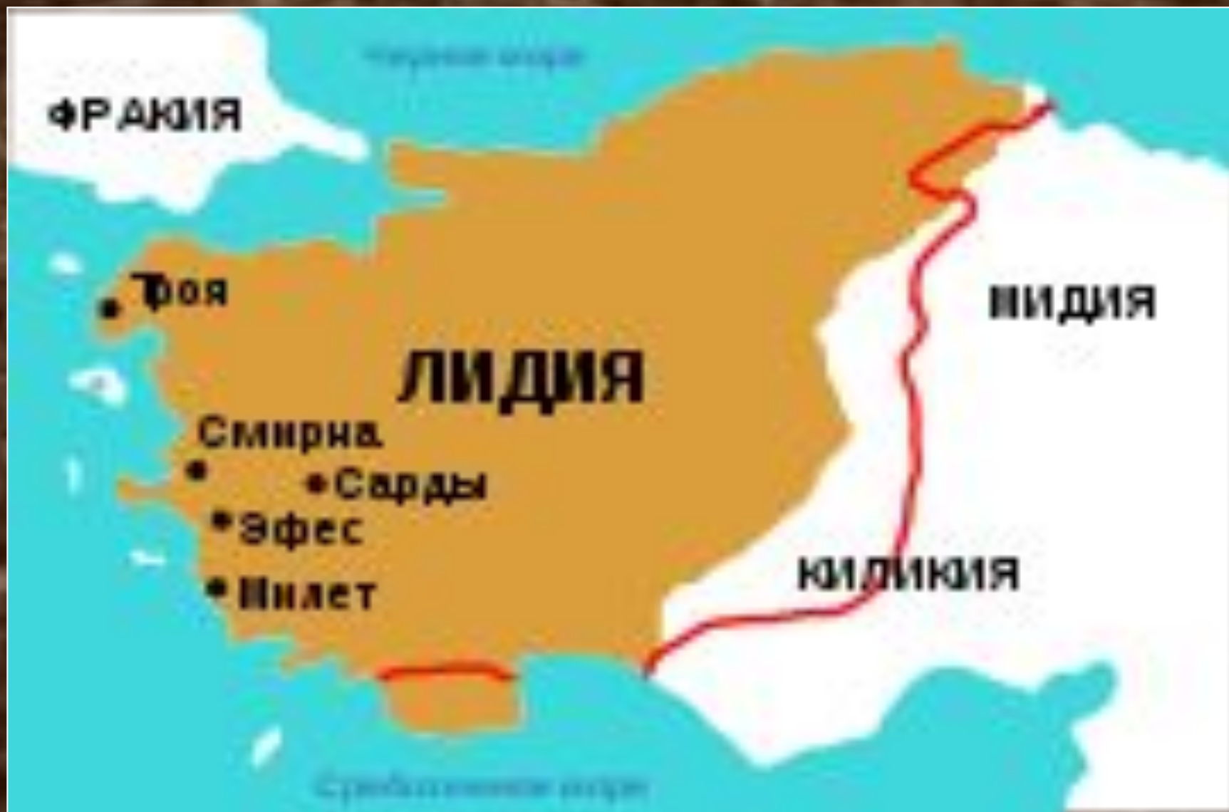
Милет – полис на побережье Малой Азии