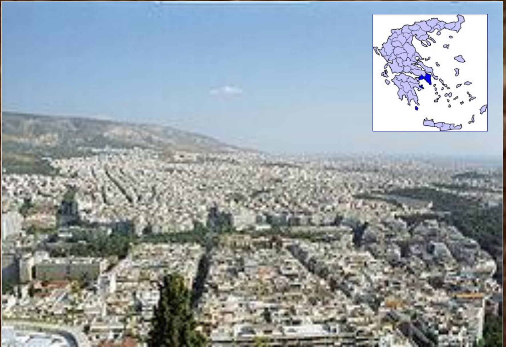
Афины. Главный город Аттики.