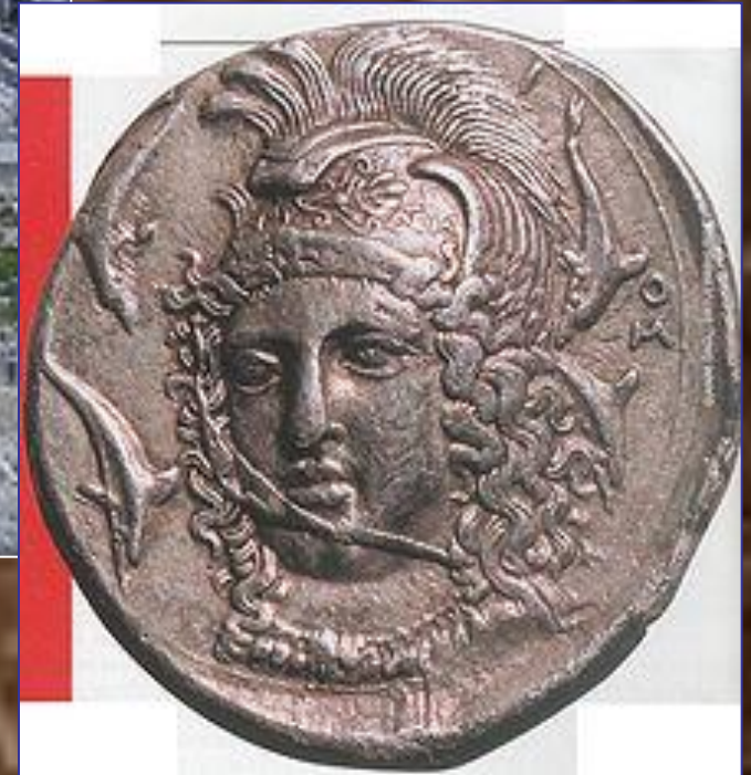
Театр в Сиракузах. Сиракузская серебряная тетрадрахма