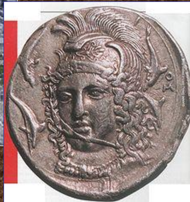
Театр в Сиракузах. Сиракузская серебряная тетрадрахма