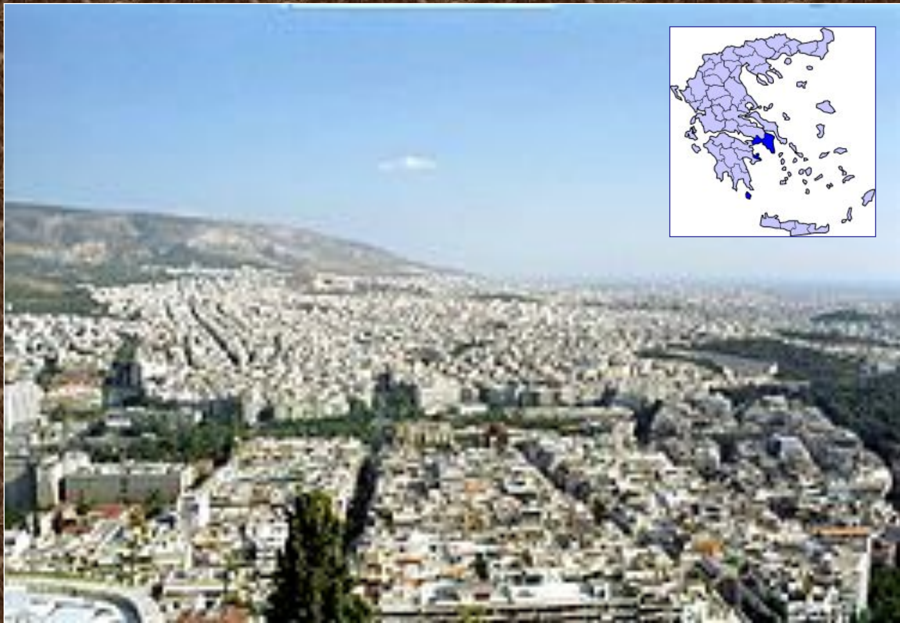
Афины. Главный город Аттики.