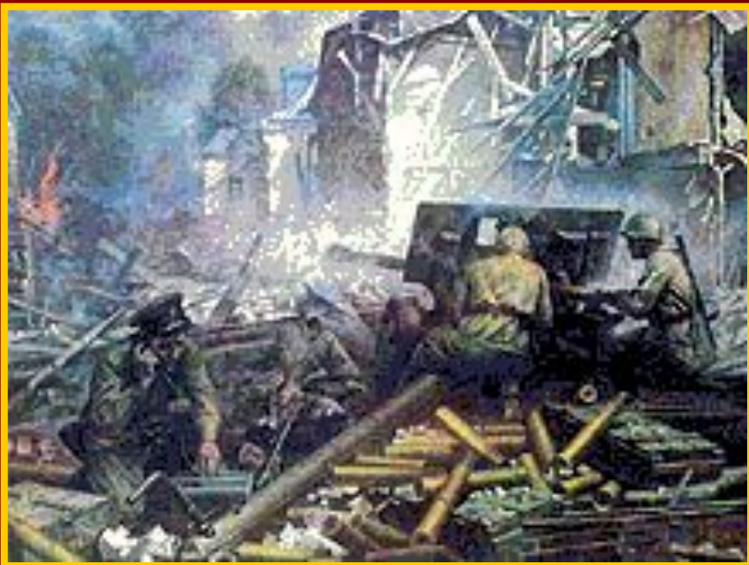
Г. Марченко. «На окраине Сталинграда»

Летом 1942 года началось наступление немецких частей на Сталинград. Несколько месяцев отборные части вермахта штурмовали город. Сталинград был превращен в руины, но сражавшиеся за каждый дом советские солдаты выстояли и перешли в наступление.