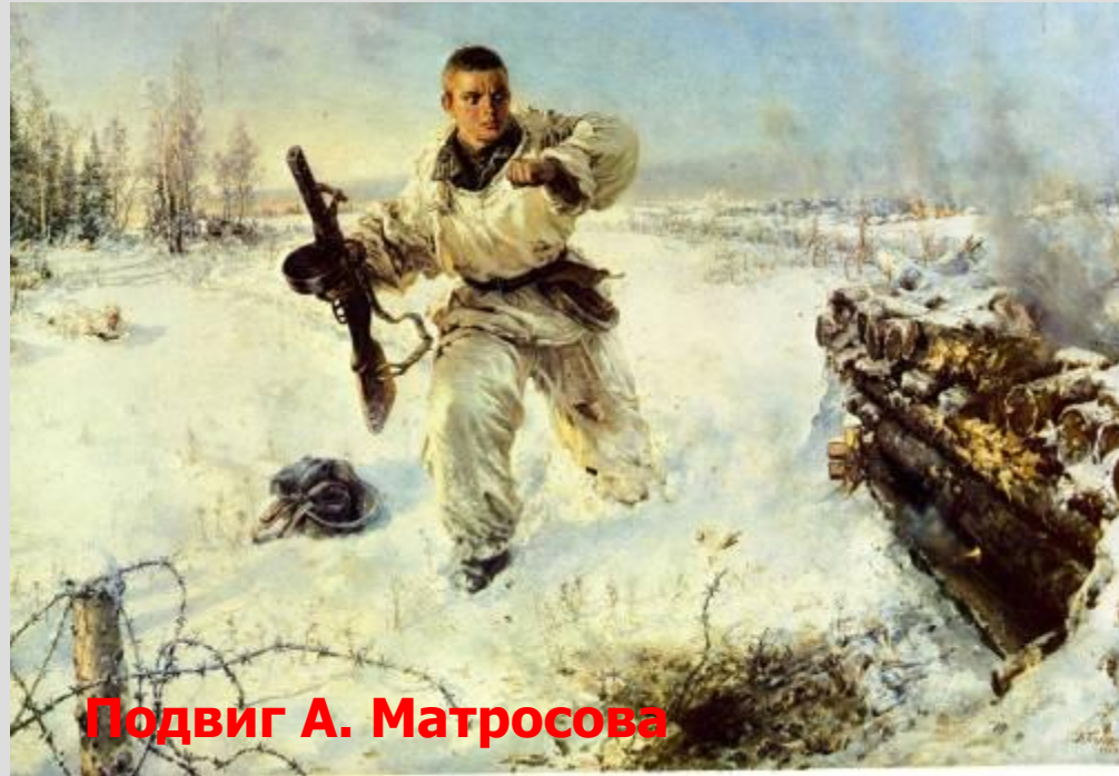
Подвиг А. Матросова

Советские воины, проявив беспримерную храбрость, доказали своё превосходство над очень сильным и коварным врагом.