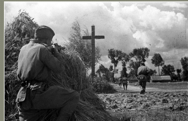
Бои у г. Познань