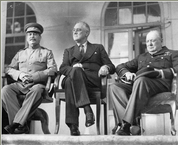
И.В. Сталин, Ф.Д.Рузвельт, У. Черчилль