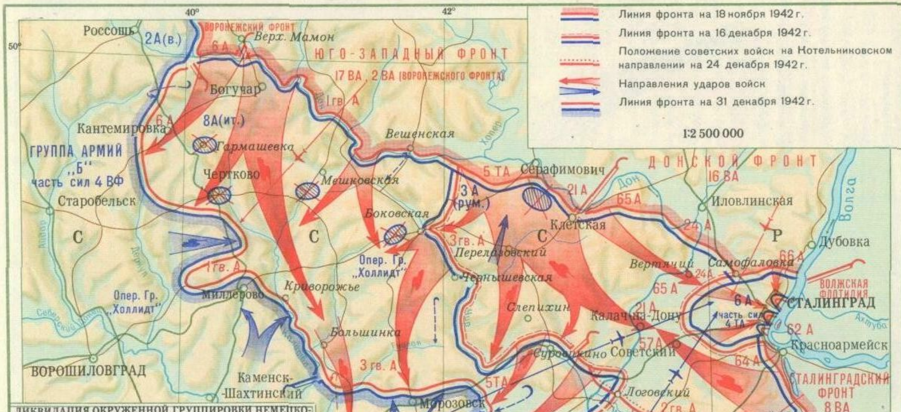
ликвидация окруженной группировки немецко-фашистских войск. 10 января – 2 февраля 1943 г.

Второй период (19 ноября 1942 г. – конец 1943 г.) – коренной перелом в войне. Измотав и обескровив противника в оборонительных сражениях, 19 ноября 1942 г. советские войска перешли в контрнаступление, окружив под Сталинградом 22 фашистские дивизии численностью более 300 тыс. человек. 2 февраля 1943 г. эта группировка была ликвидирована. В это же время вражеские войска были изгнаны с Северного Кавказа. К лету 1943 г. советско-германский фронт стабилизировался.