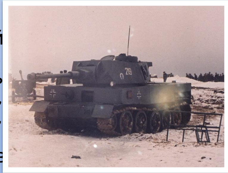
Тяжёлый танк «Тигр»