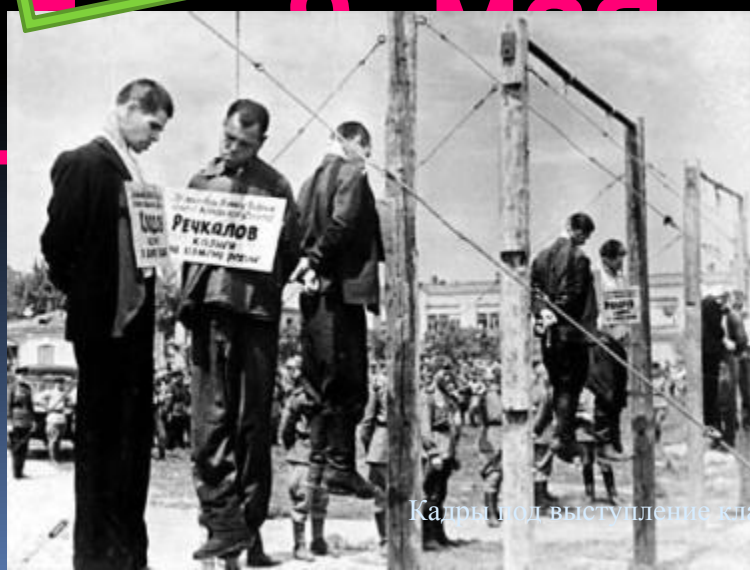
Кадры мол выступление класса