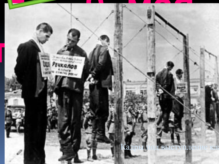
Кадры мол выступление класса