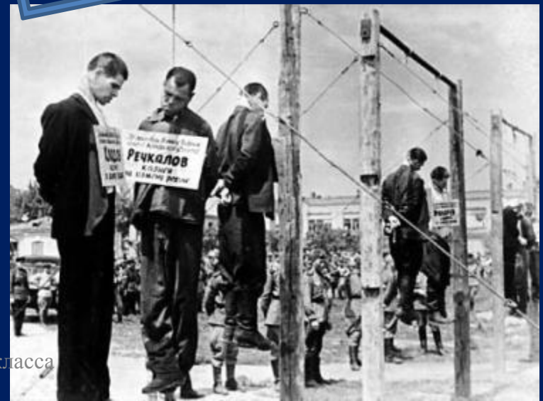
Кадры под выступление класса