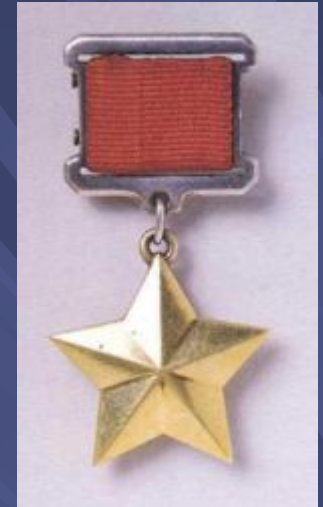
Сафонов Борис Феоктистович 26. 8. 1915 - 30. 5. 1942 Дважды Герой Советского Союза