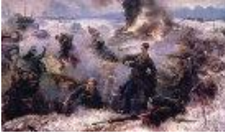
Защитники Брестской крепости