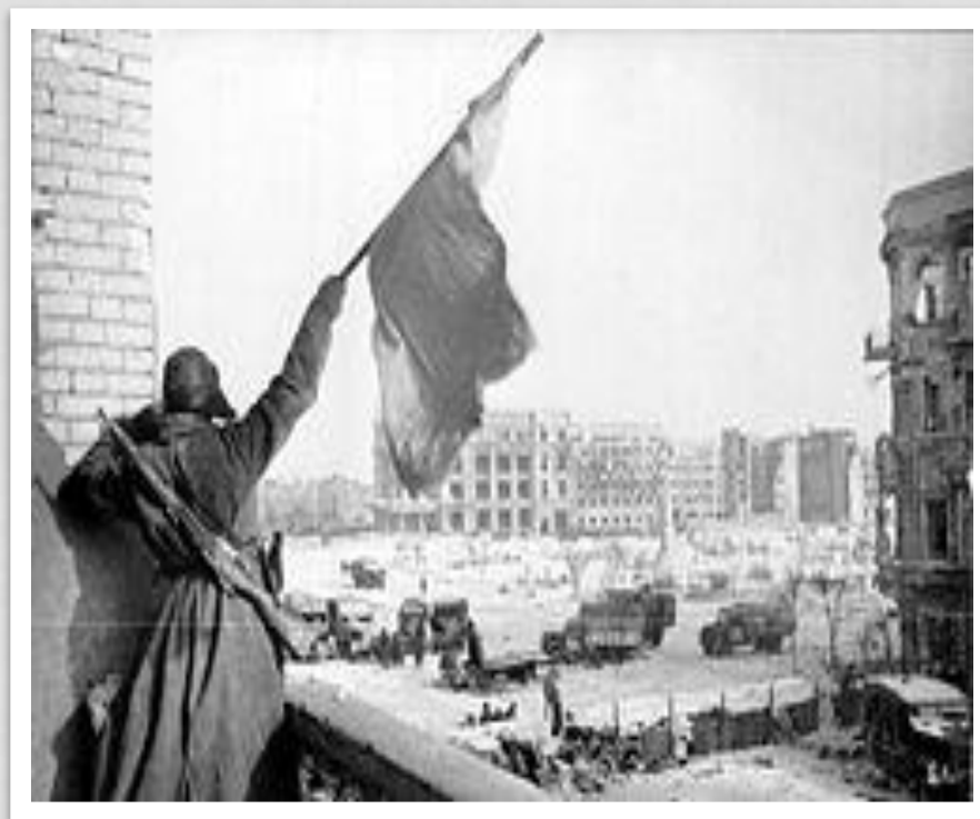
Флаг над освобождённым городом, Сталинград, 1943 г.