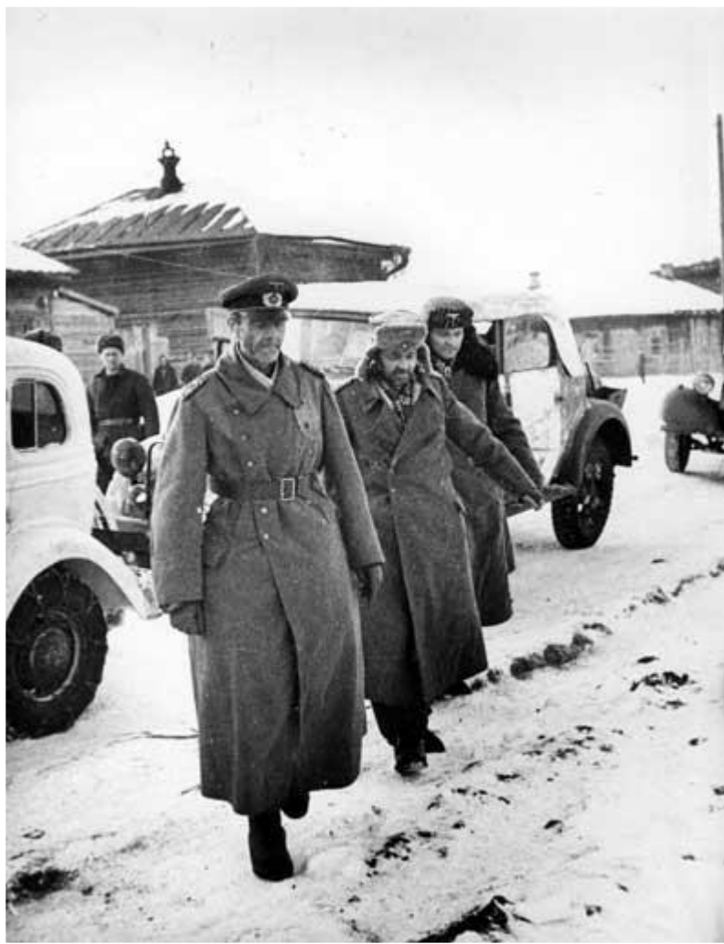
На снимке 1 февраля 1943 года сдавшийся накануне в плен генерал-фельдмаршал Фридрих Паулюс