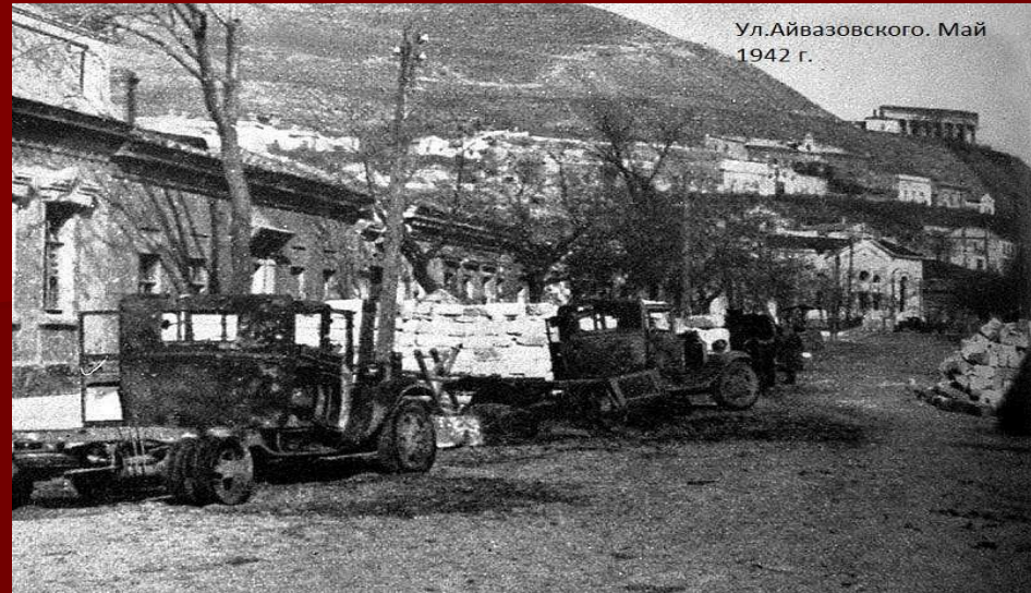
Ул. Айвазовского. Май 1942 г.