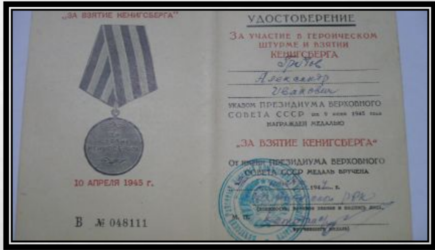
За заслуги в войне прадедущка награжден медалями: «За отвагу», «За боевые заслуги», «За взятие Кенигсберга», «За победу над Германией», «За победу над Японией».