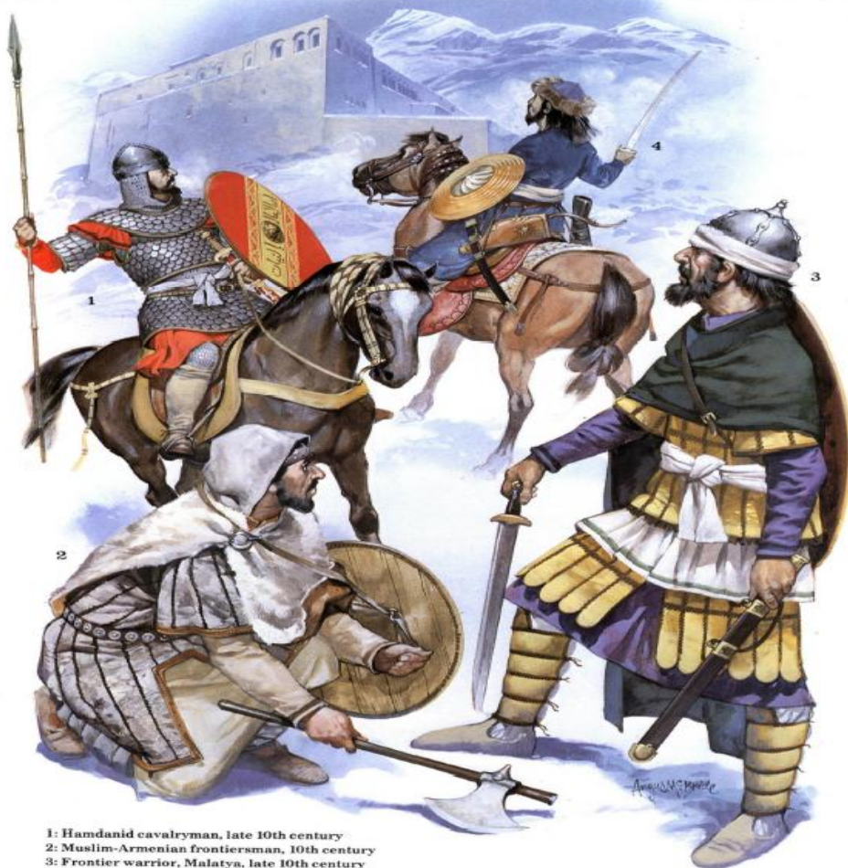
1: Hamdanid cavalryman, late 10th century 2: Muslim-Armenian frontiersman, 10th century 3: Frontier warrior, Malatya, late 10th century 4: Saljuq Turcoman horse-archer, late 11th century