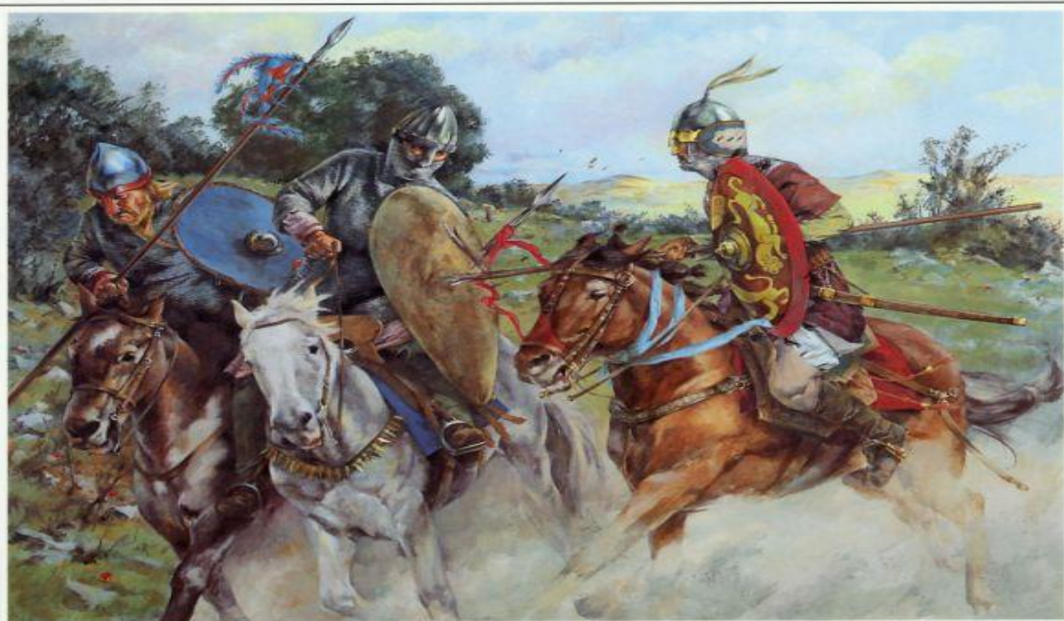
The charge of Yaqut the Tall

При султане Мухаммеде Тепере начал борьбу с Исмаидами, крестоносцами. Восстановил свой суверенитет