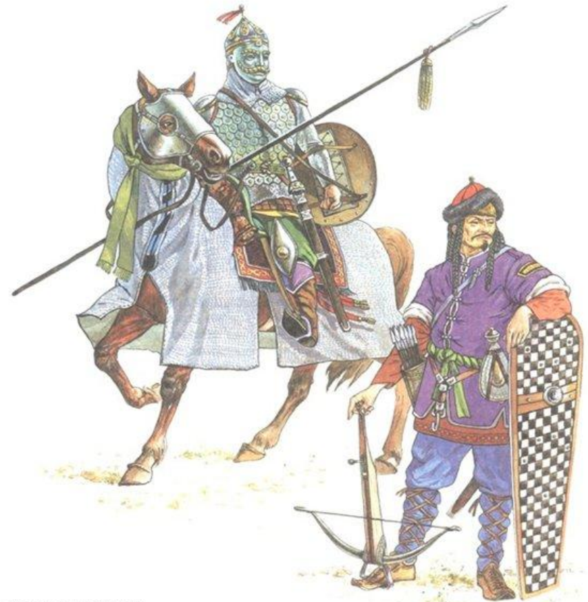
Сельджуки 13 век