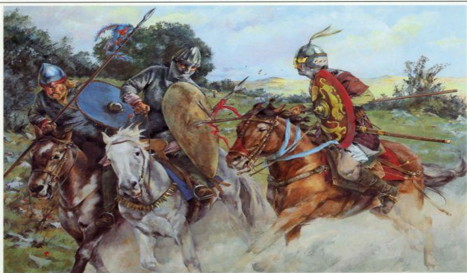
The charge of Yaqut the Tall

При султане Мухаммеде Тепере начал борьбу с Исмаилидами, крестоносцами. Восстановил свой суверенитет