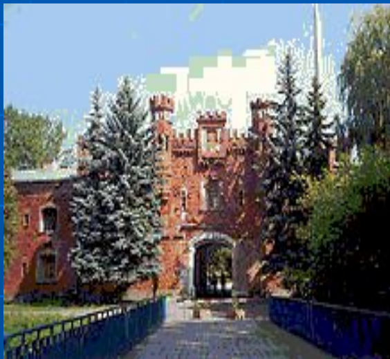
Брестская крепость. Холмский ворота.