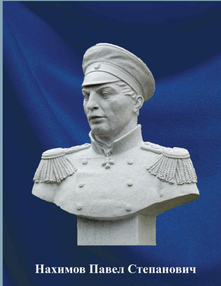
Нахимов Павел Степанович

П.С.Нахимов обладал большими военными дарованиями; отличался смелостью и неординарностью тактических решений, личным мужеством и хладнокровием. В бою стремился максимально избежать потерь. Огромное значение придавал боевой выучке матросов и офицеров.