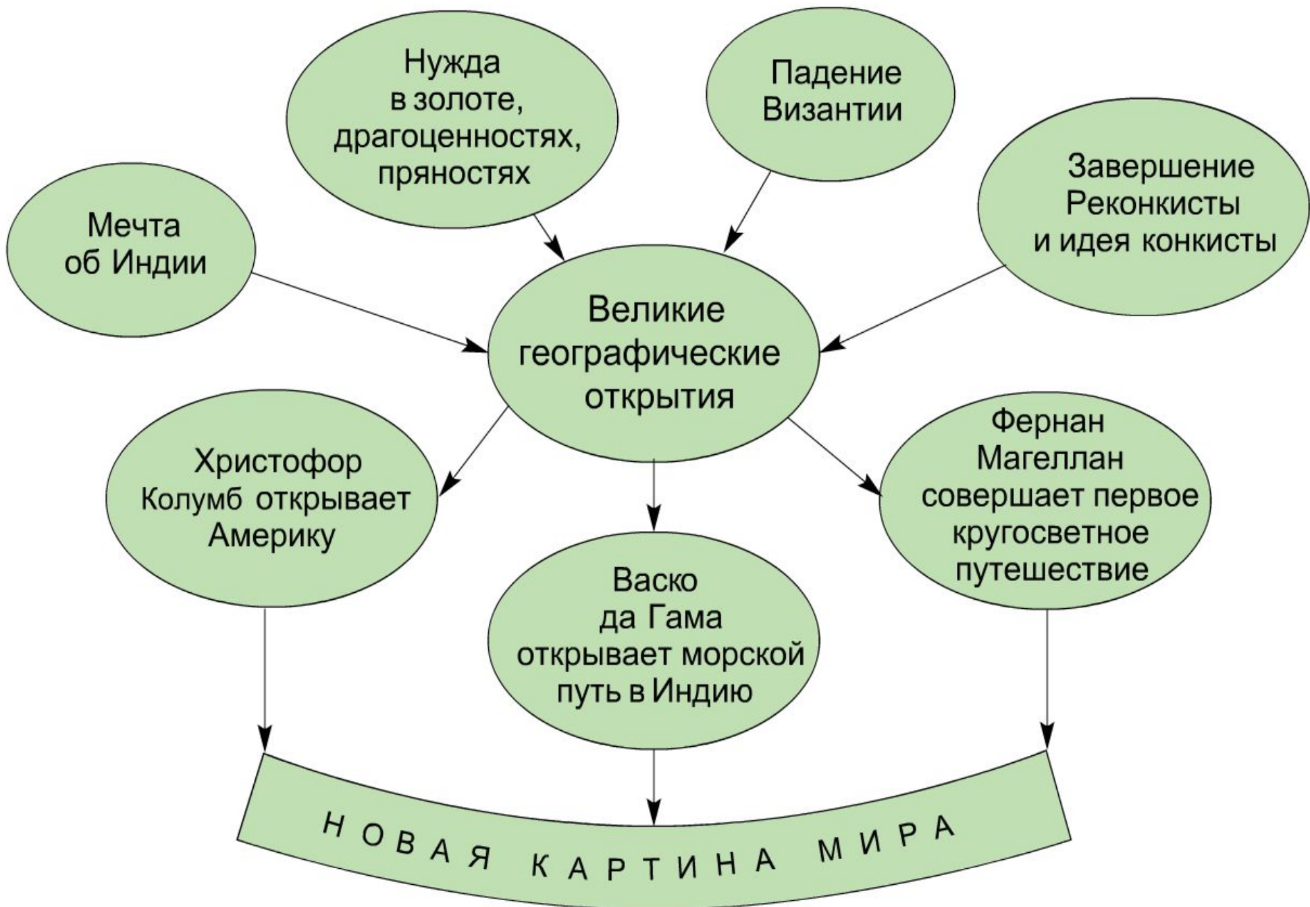
Схема "Великие географические открытия"