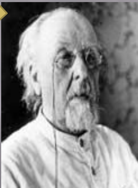
Константин Эдуардович Циолковский Королев