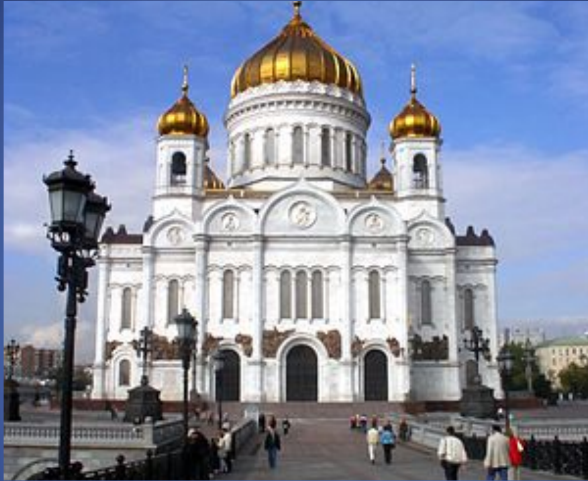
Храм Христа Спасителя.