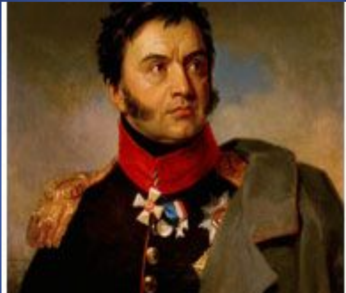
Портрет Н.Н. Раевского (1771 – 1829)