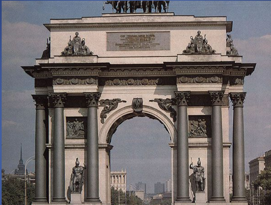
Триумфальная арка- вид с Поклонной горы