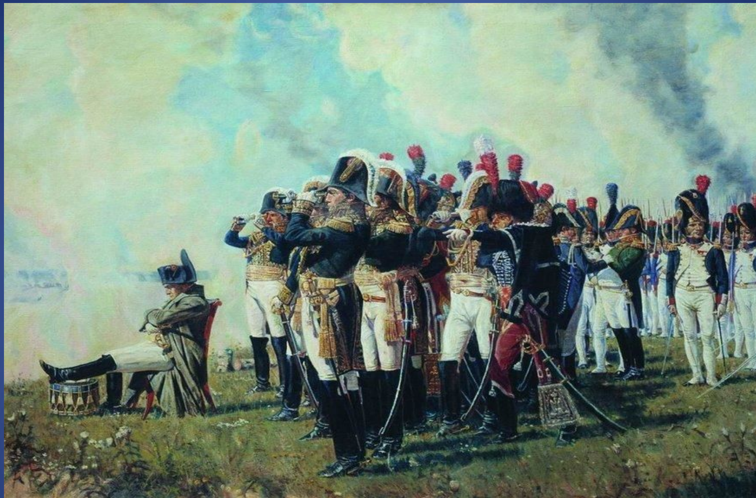
Василий Верещагин Наполеон на Бородинском поле