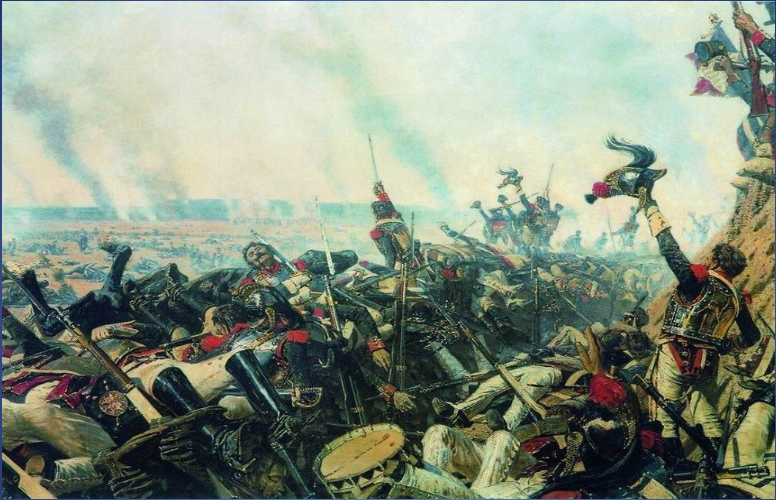
Василий Верещагин Конец Бородинской битвы, 1900