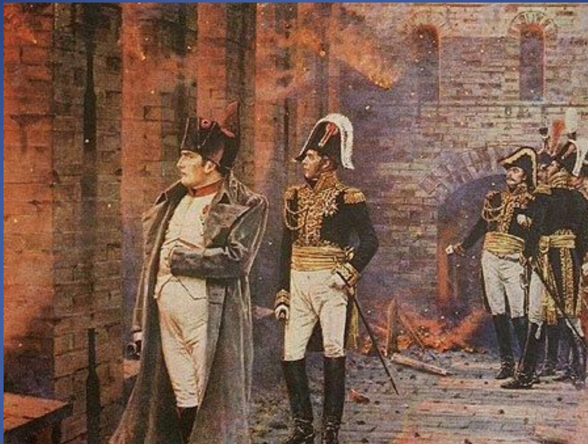
Василий Верещагин В Кремле - пожар! 1887-1898