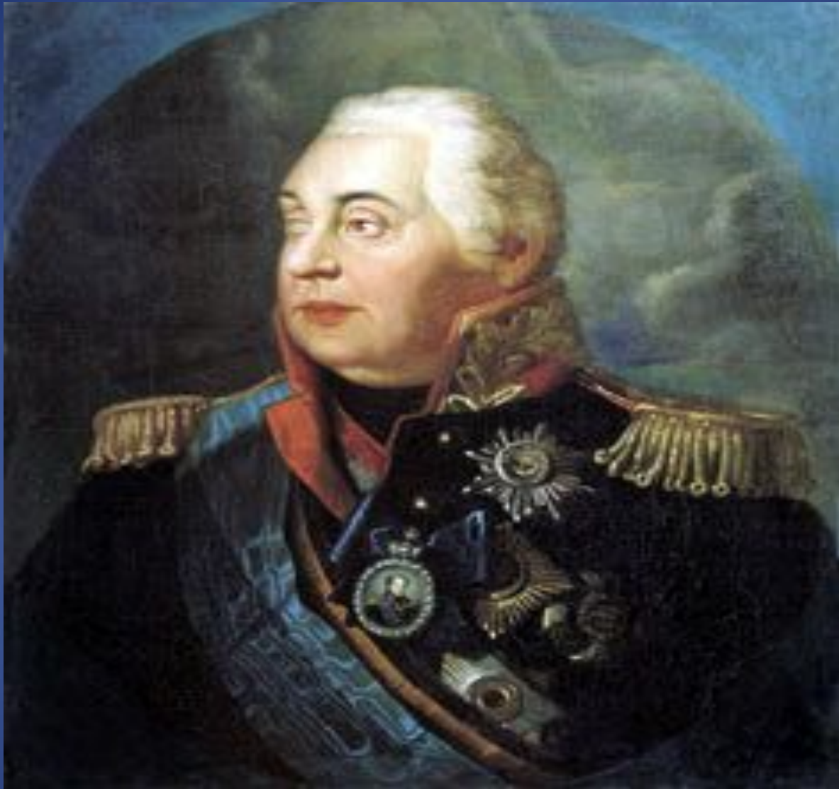
Голенищев-Кутузов Михаил Илларионович 1745 - 1813