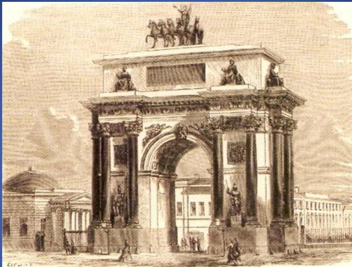
Триумфальная арка. Первоначальный вариант у площади Тверской заставы.