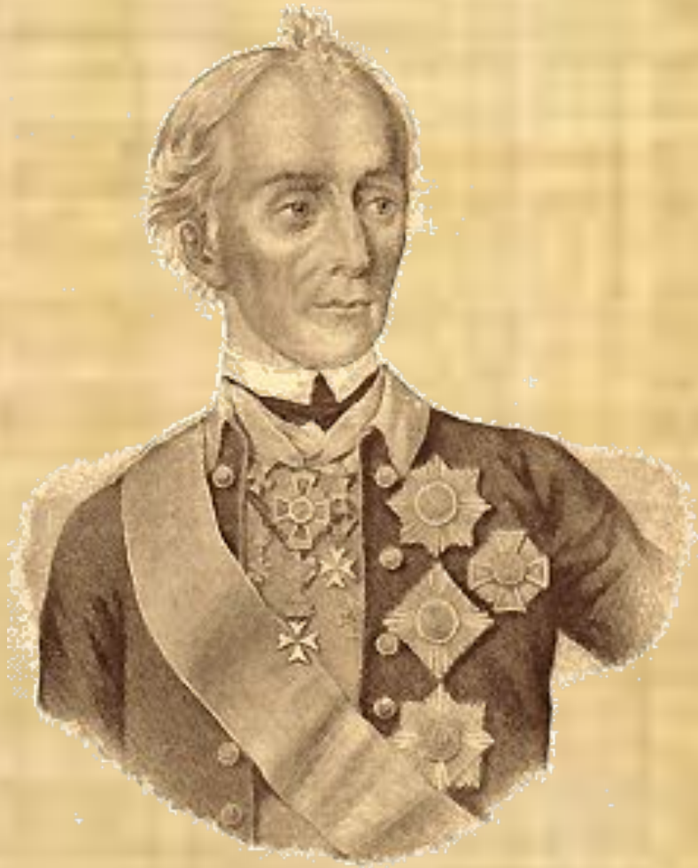
Александр Васильевич Суворов