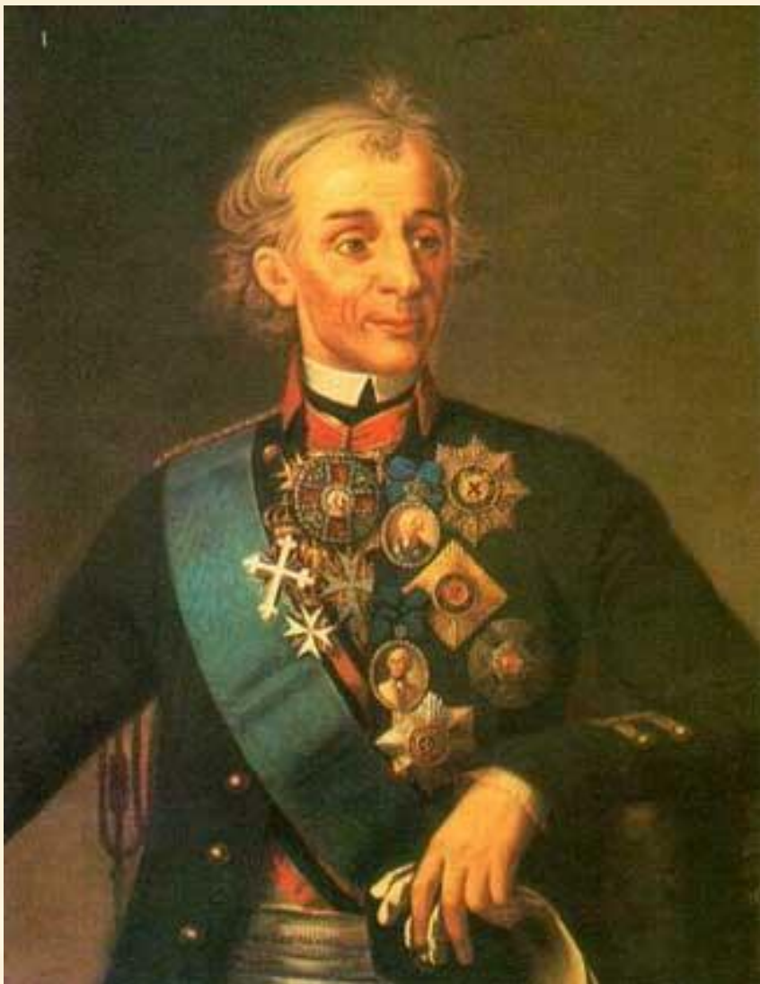
Александр Васильевич Суворов (1730 – 1800 )