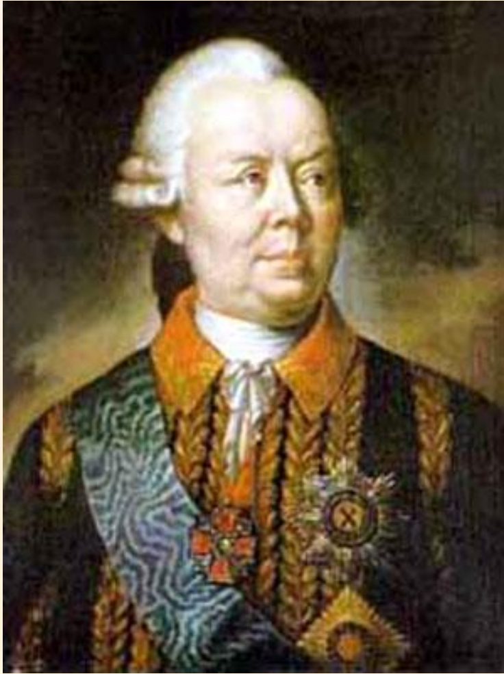
Пётр Александрович Румянцев (1725 – 1796)