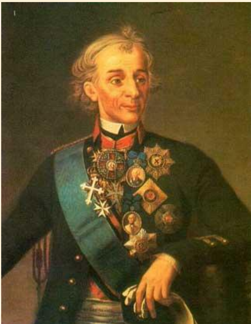
Александр Васильевич Суворов (1730 – 1800 )