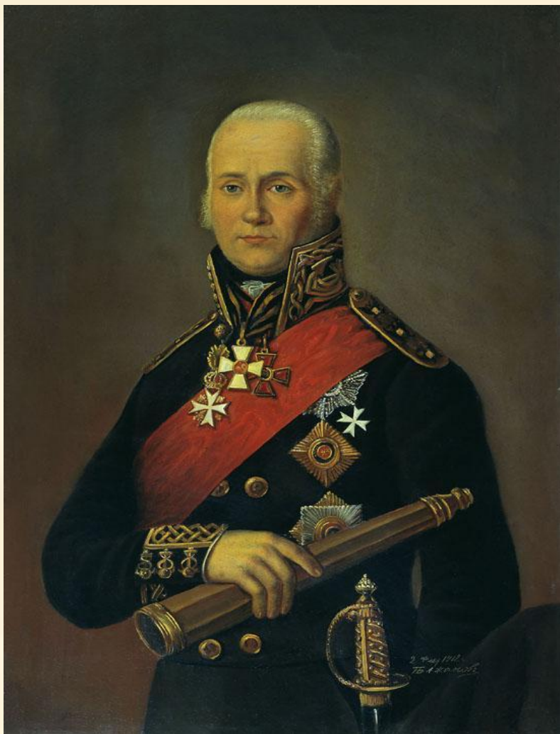
Фёдор Фёдорович Ушаков (1745 – 1817)