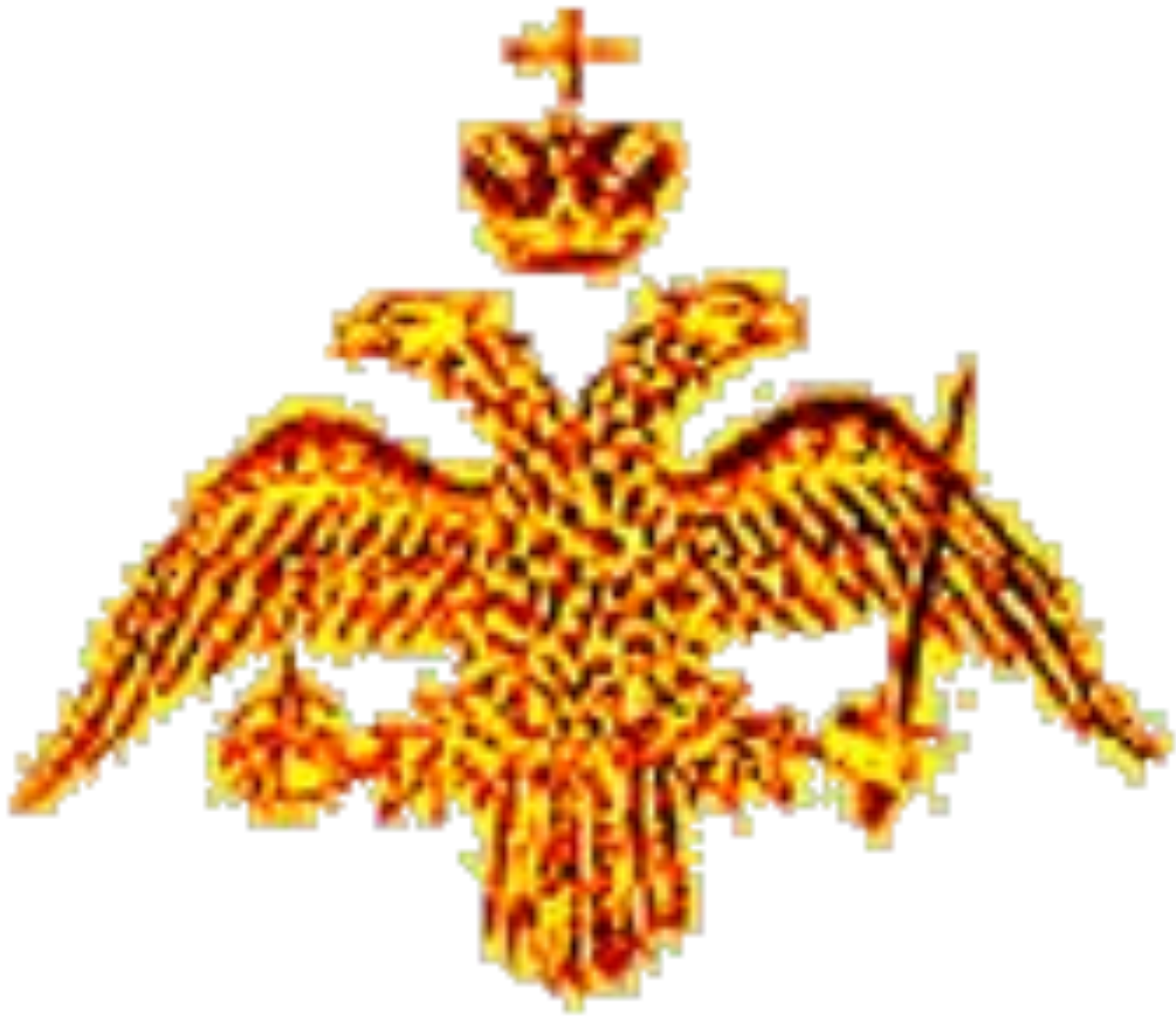
Герб Византийской империи