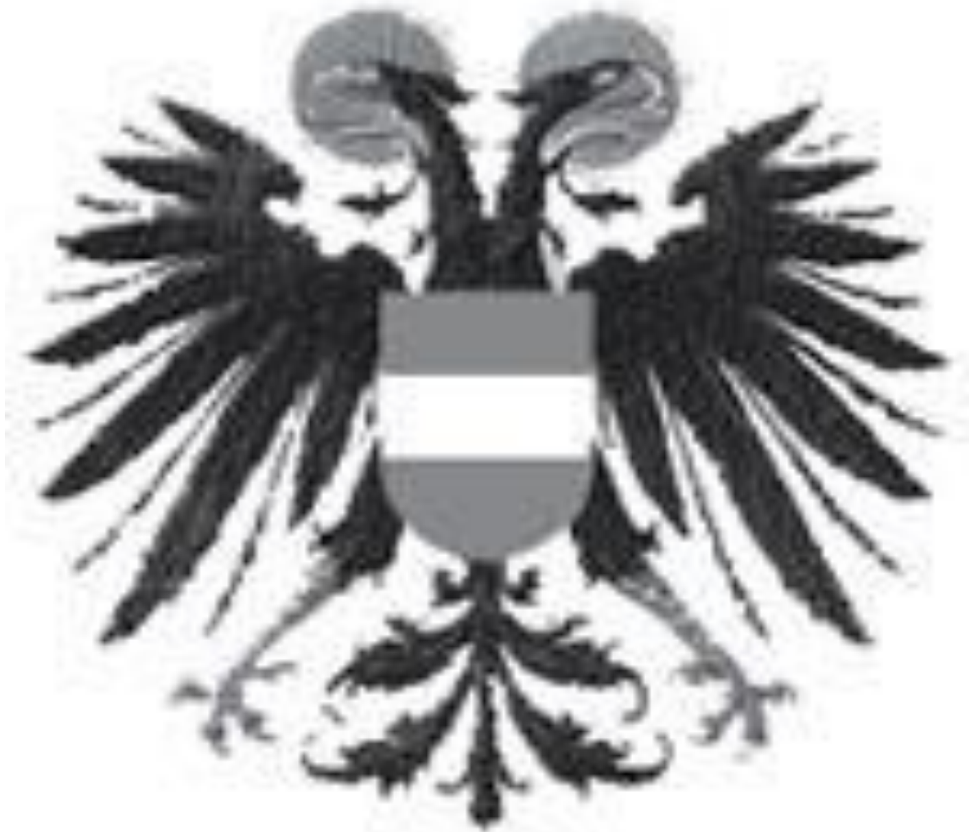
герб Священной Римской Империи