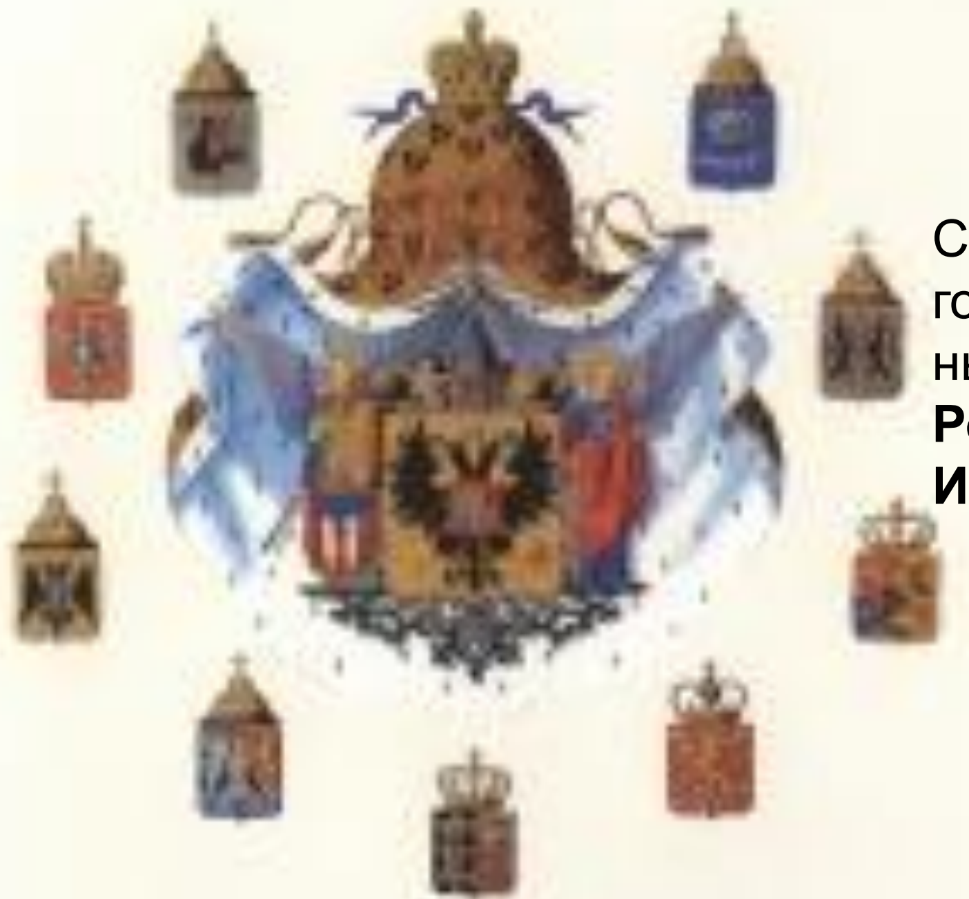
Средний государствен ный герб Российской Империи