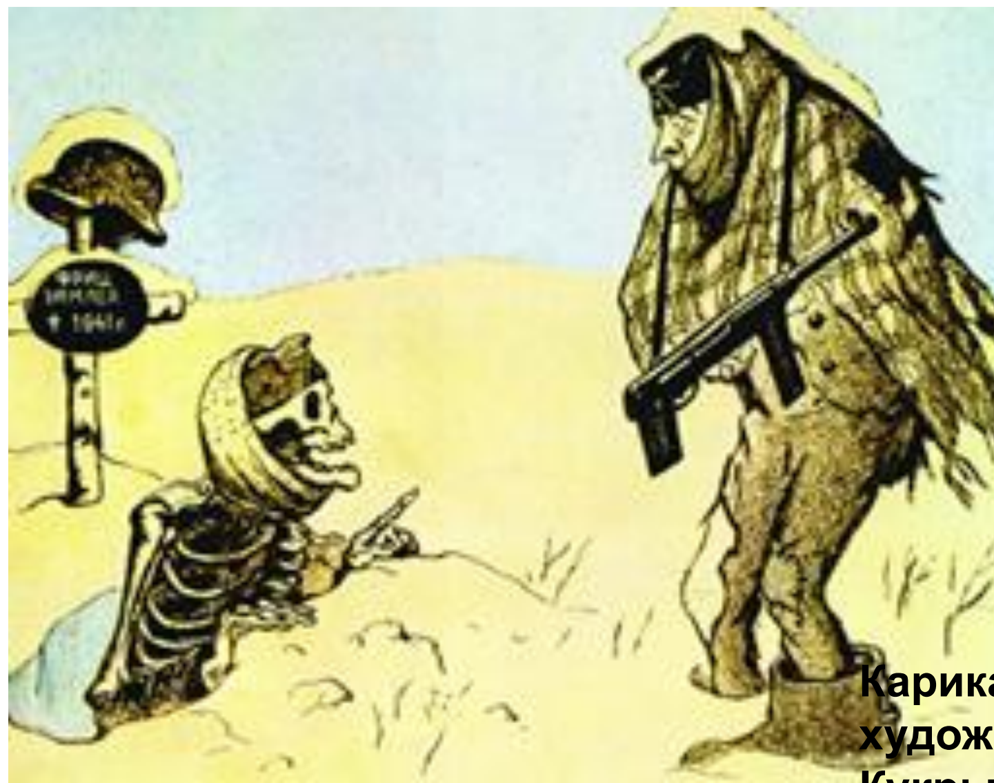
Карикатура художников Кукрыниксо в