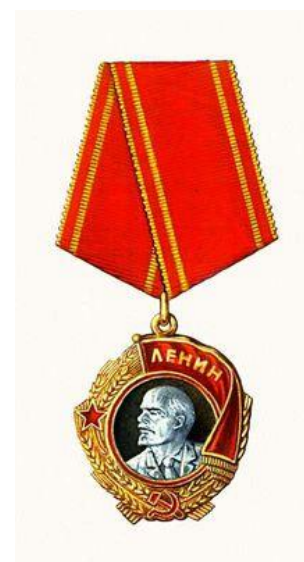
Яков Федорович Павлов