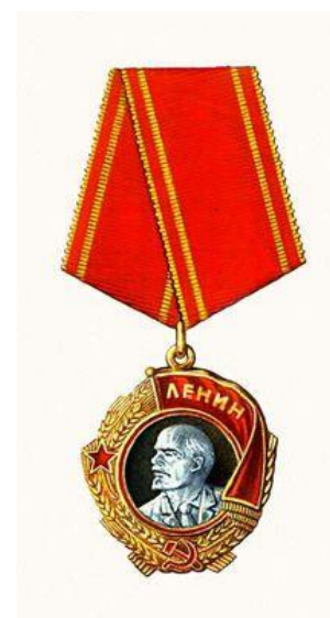
Яков Федорович Павлов