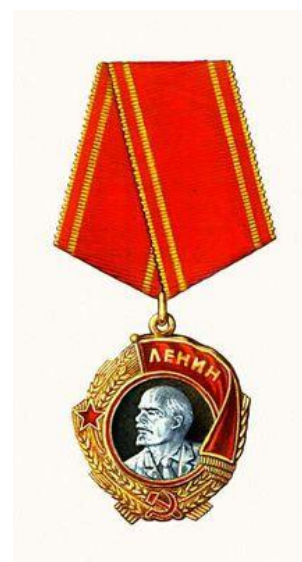
Яков Федорович Павлов