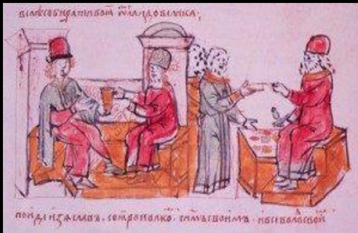
Беседа князей Изяслава Ярославича и Всеволода Ярославича о действиях против половцев. Наем воинов по приказу Изяслава. Миниатюра из Радзивилловской летописи. Кон. XV в. (БАН. 34.5.30. Л. 116, верх)