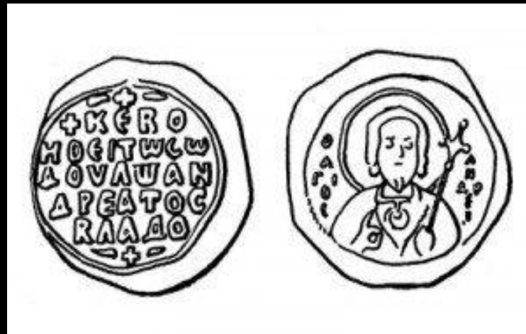
Печать кн. Всеволода Ярославича. 1054–1078 гг. Прорись (Нац. музей, Варшава) Кон. XV в. (БАН. 34.5.30. Л. 116, верх)