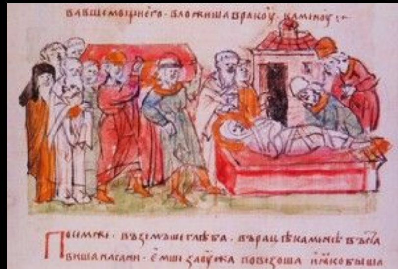
Перенесение мощей св. Бориса князьями Ярославичами с духовенством. Миниатюра из Радзивилловской летописи. Кон. XV в. (БАН. 34.5.30. Л. 106 об.)