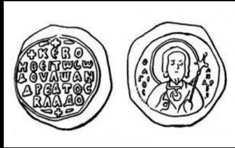
Печать кн. Всеволода Ярославича. 1054–1078 гг. Прорись (Нац. музей, Варшава) Кон. XV в. (БАН. 34.5.30. Л. 116, верх)