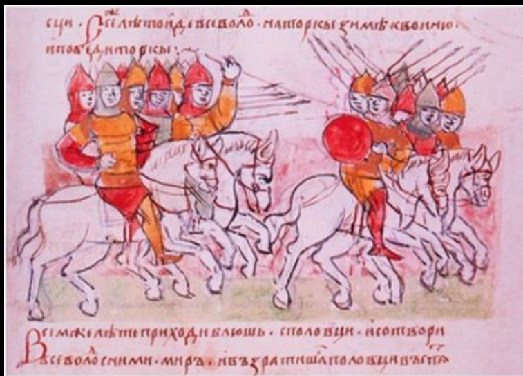
Победа кн. Всеволода Ярославича над кочевниками-торками. Миниатюра из Радзивилловской летописи. Конец XV в.