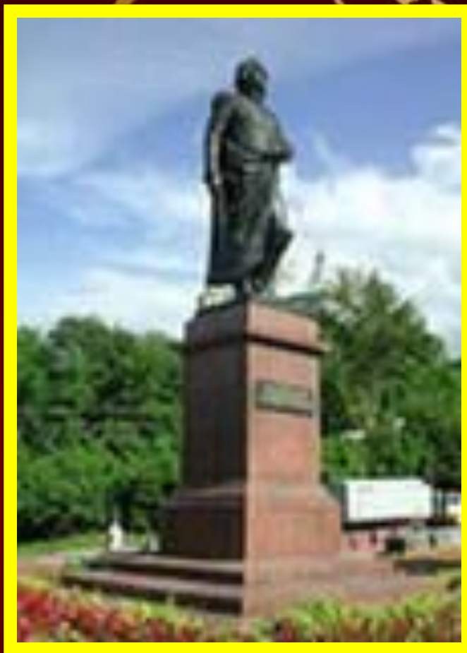
Памятник М.И. Кутузову в Смоленске.