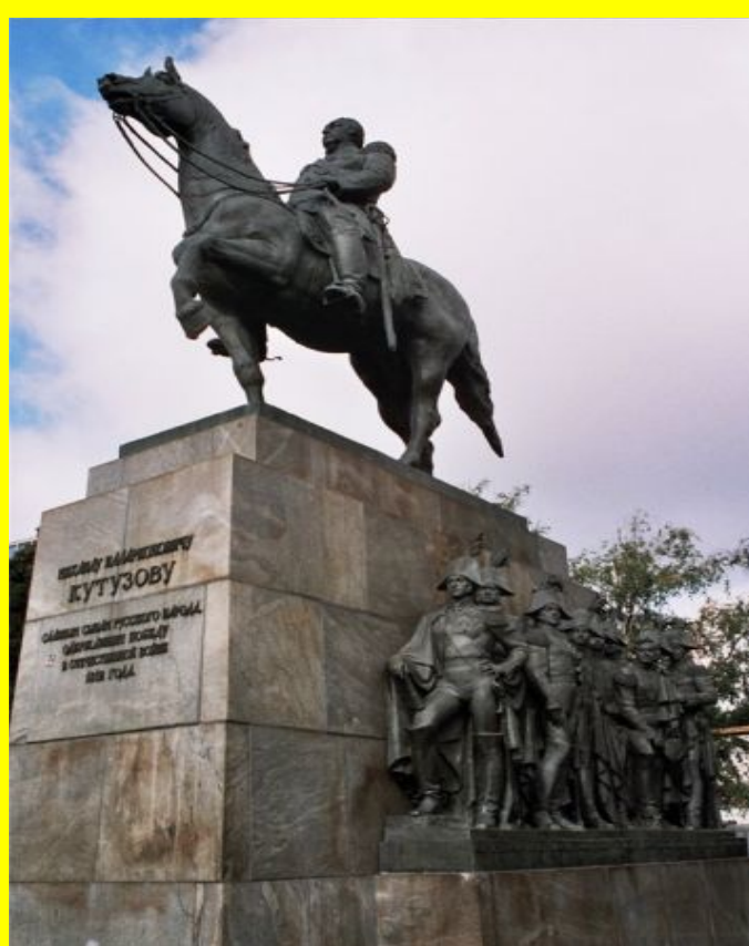
Памятник Кутузову в Москве. (скульптор – Н. В. Томский. )