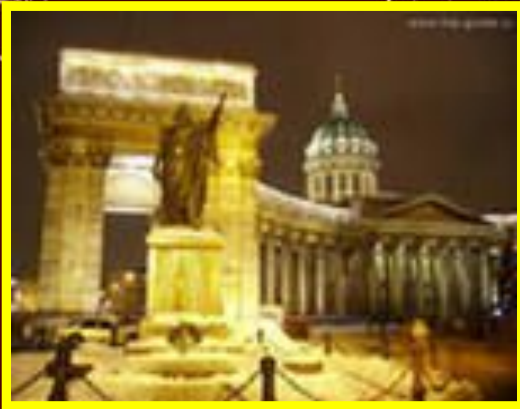
Санкт-Петербург, Памятник Кутузову.