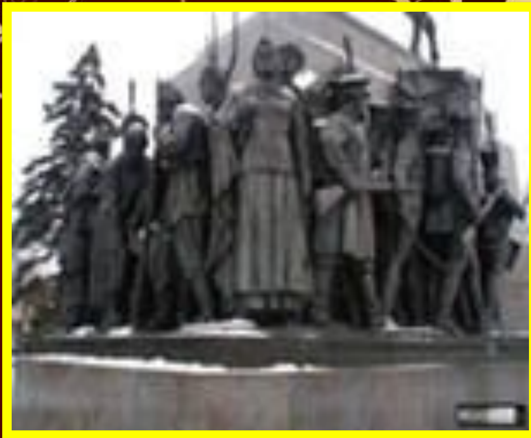
Москва. Дорогомилово. Кутузовский проспект: памятник Кутузову