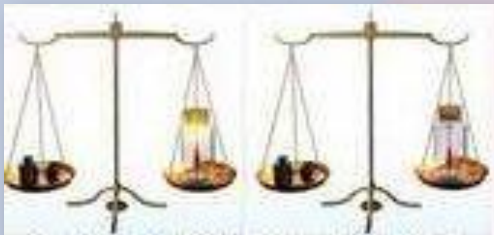
Рисунок иллюстрирует Закон сохранения массы вещества формулированный М.В. Ломоносовым.