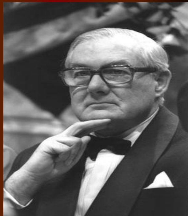
1976 – 1979 гг. Джеймс Каллаган