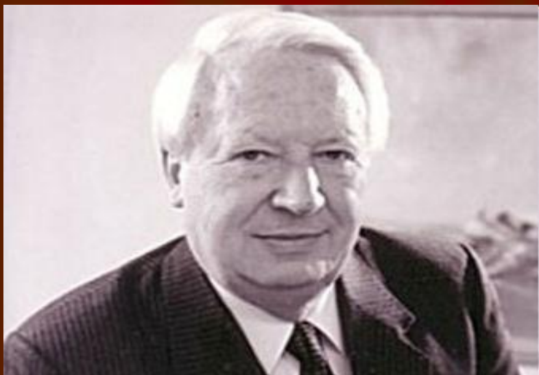
1970 – 1974 гг. Эдвард Хит