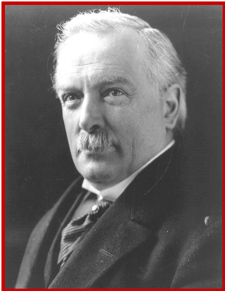
Дэвид Ллойд Джордж (1863—1945). Лидер либеральной партии

Умеренные реформы во имя «классового мира».