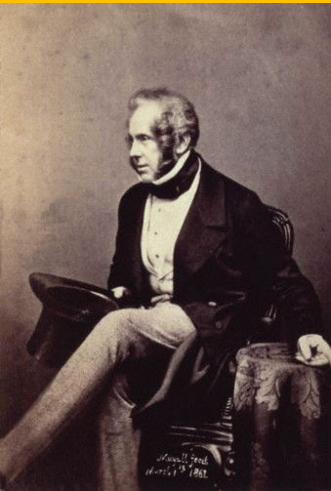
Генри Палмерстон, Английский дипломат

Цель - сохранение равновесия в Европе. Колониальный характер.