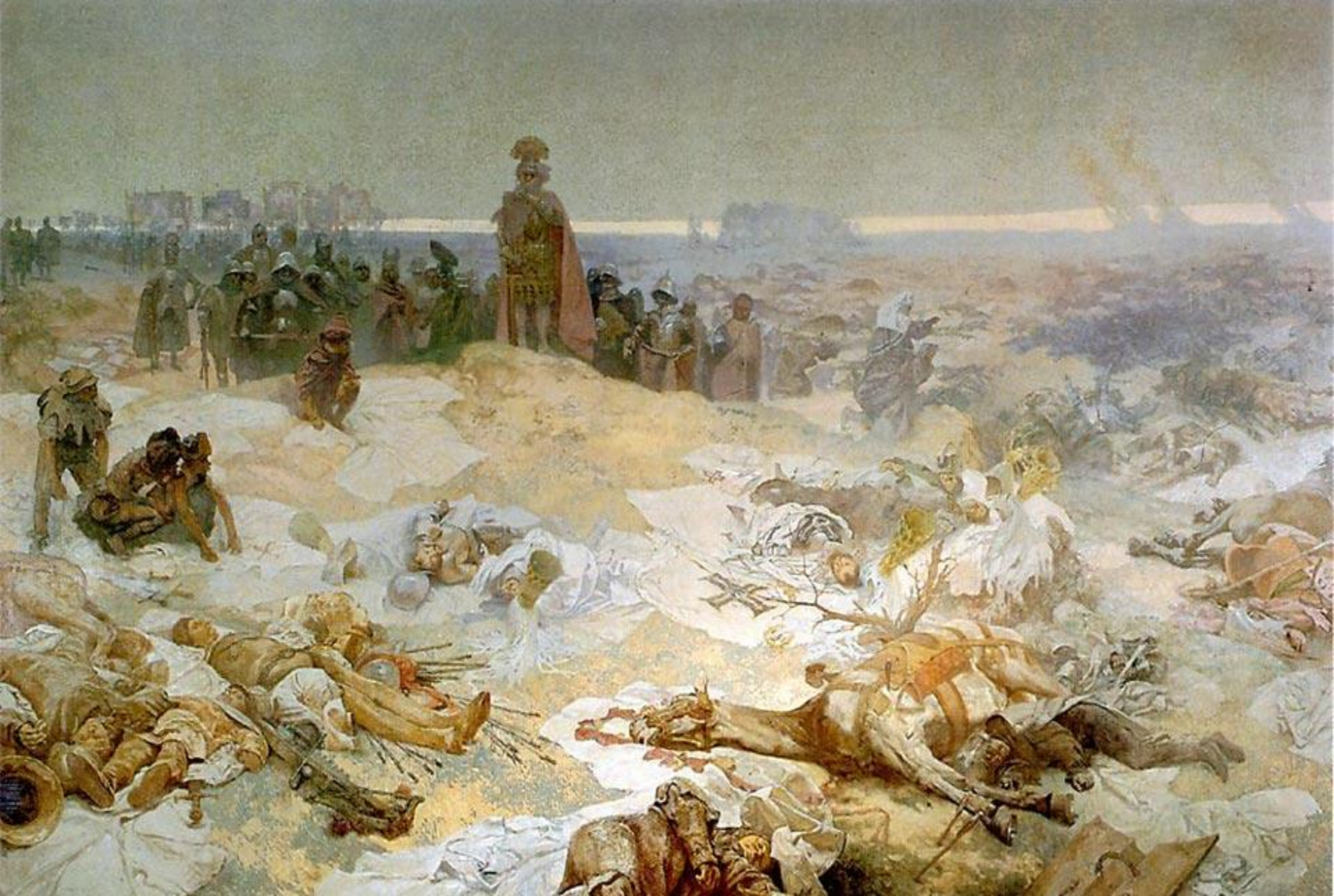
ПОСЛЕ ГРЮНВАЛЬДСКОЙ БИТВЫ. АДЪ ФОНС МУУА