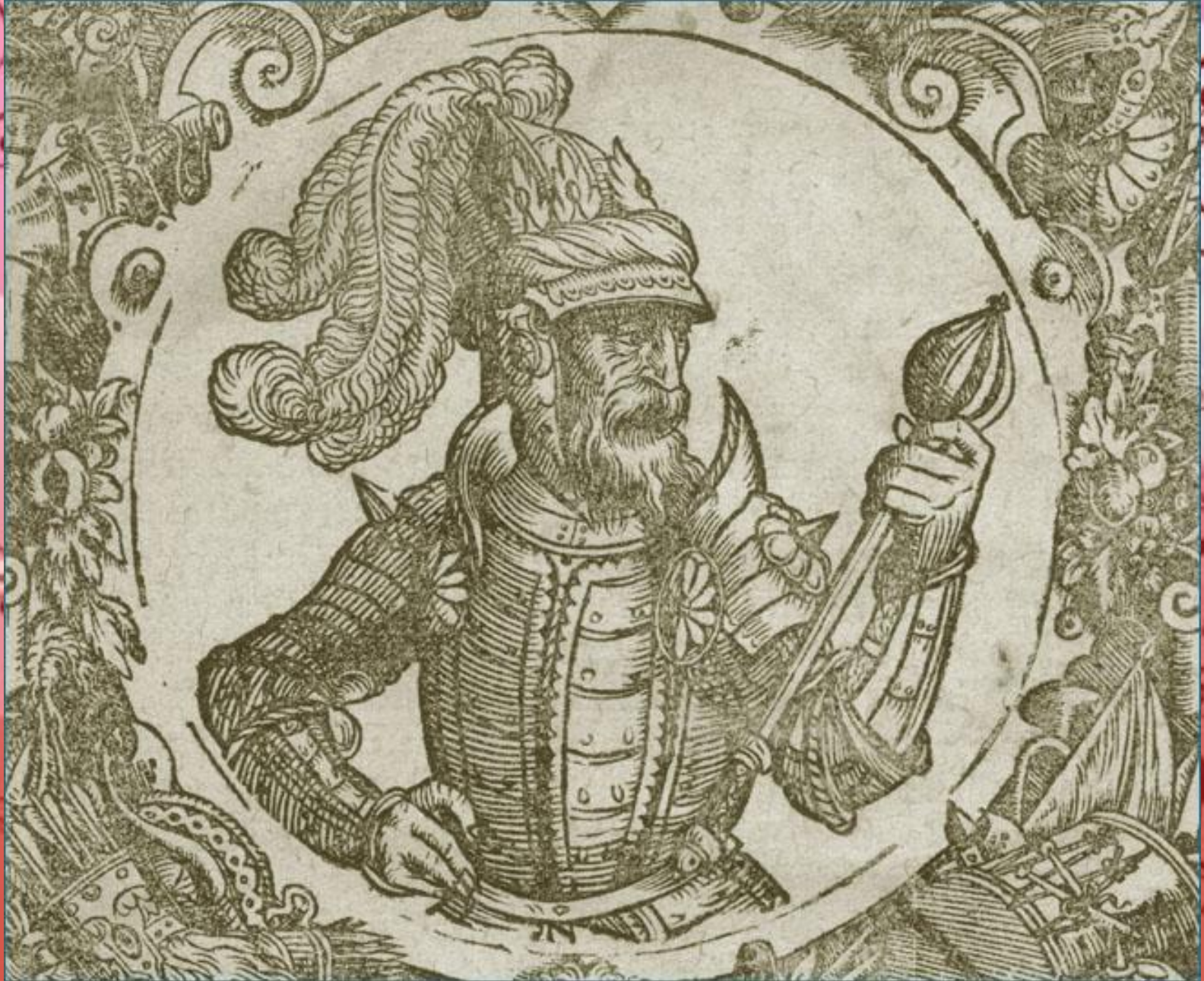
ОЛЬГЕРД – СЫН ГЕДИМИНА И РУССКОЙ КНЯЖНЫ ОЛЬГИ