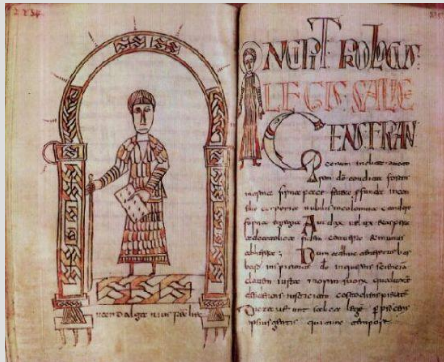
«Салическая правда» франков