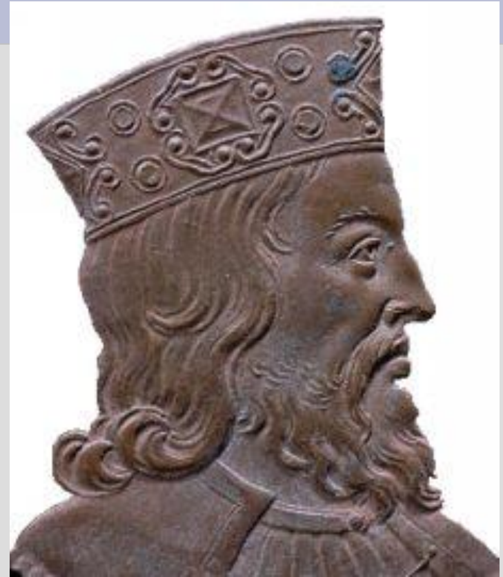
Изображение Хлодвига – короля франков