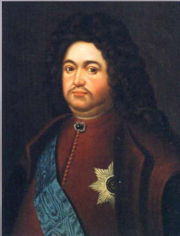
Фёдор Алексеевич Головин