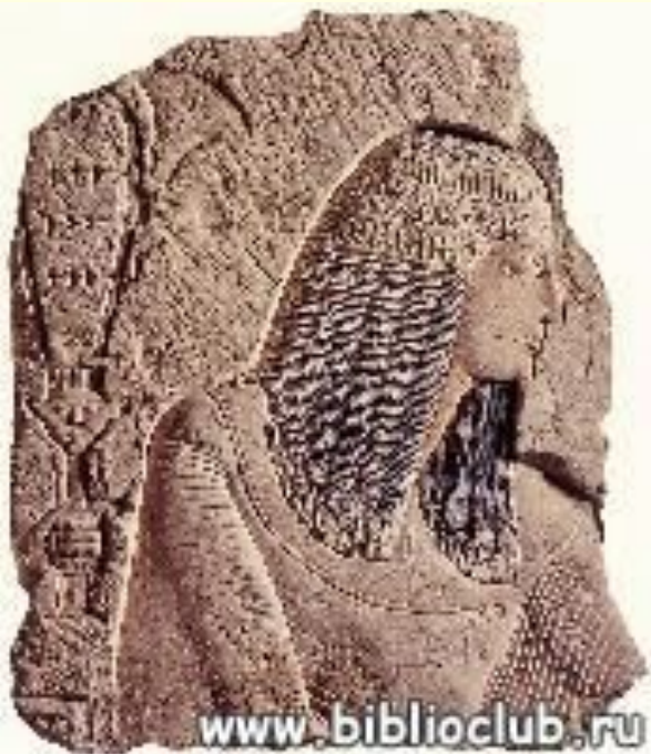
Рельеф с изображением вельможи