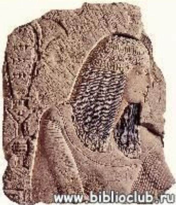
Рельеф с изображением вельможи