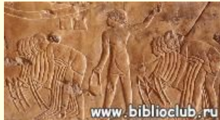
Работа в поле