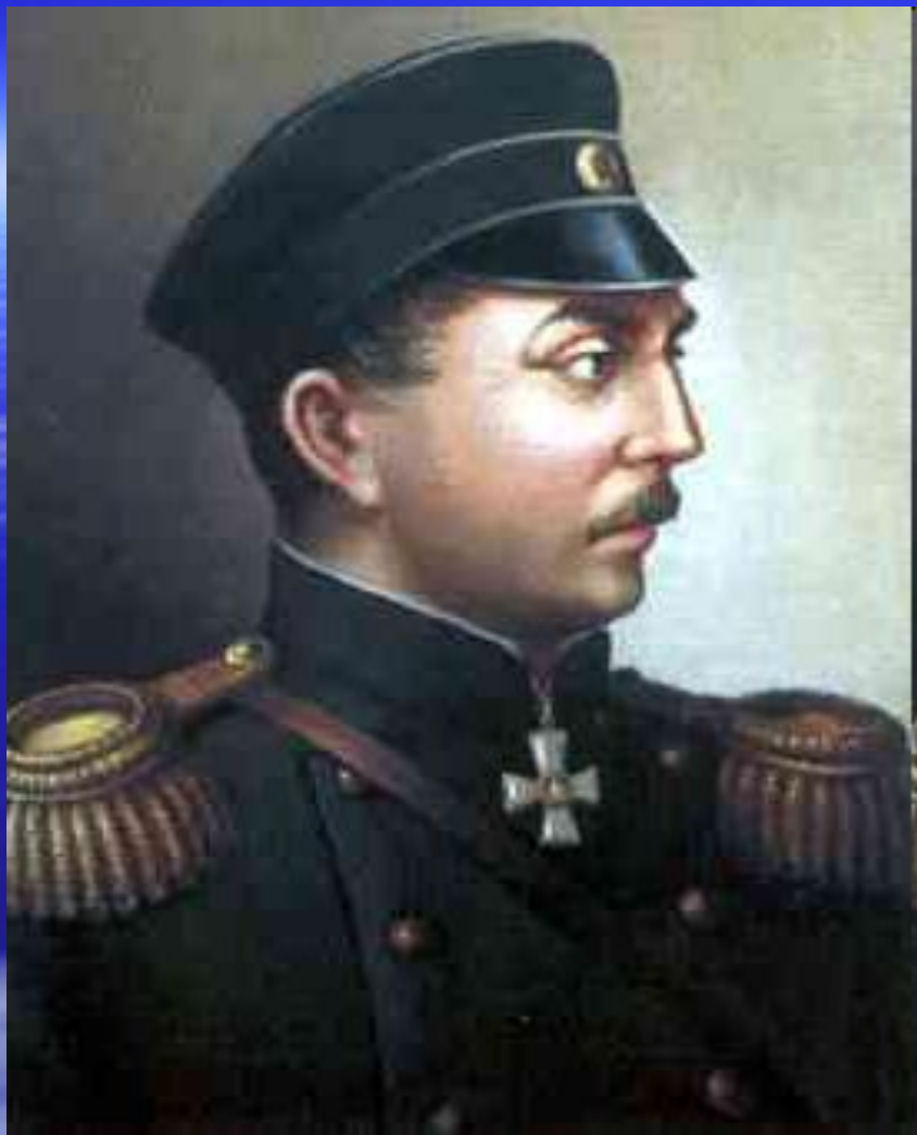
Павел Степанович Нахимов (23 июня (5 июля) 1802, сельцо Городок, Вяземский уезд, Смоленская губерния — 30 июня (12 июля) 1855, Севастополь, Таврическая губерния Российская империя) — знаменитый русский адмирал.