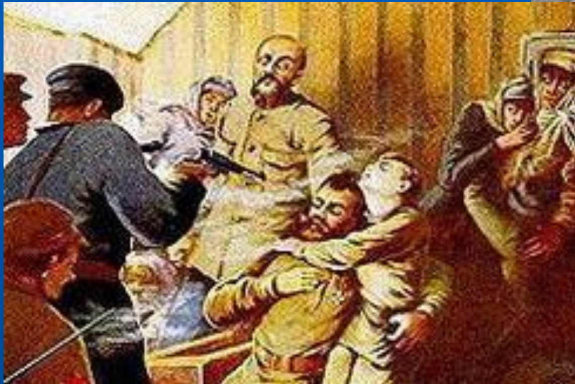
Яков Юровский начальник ЧК