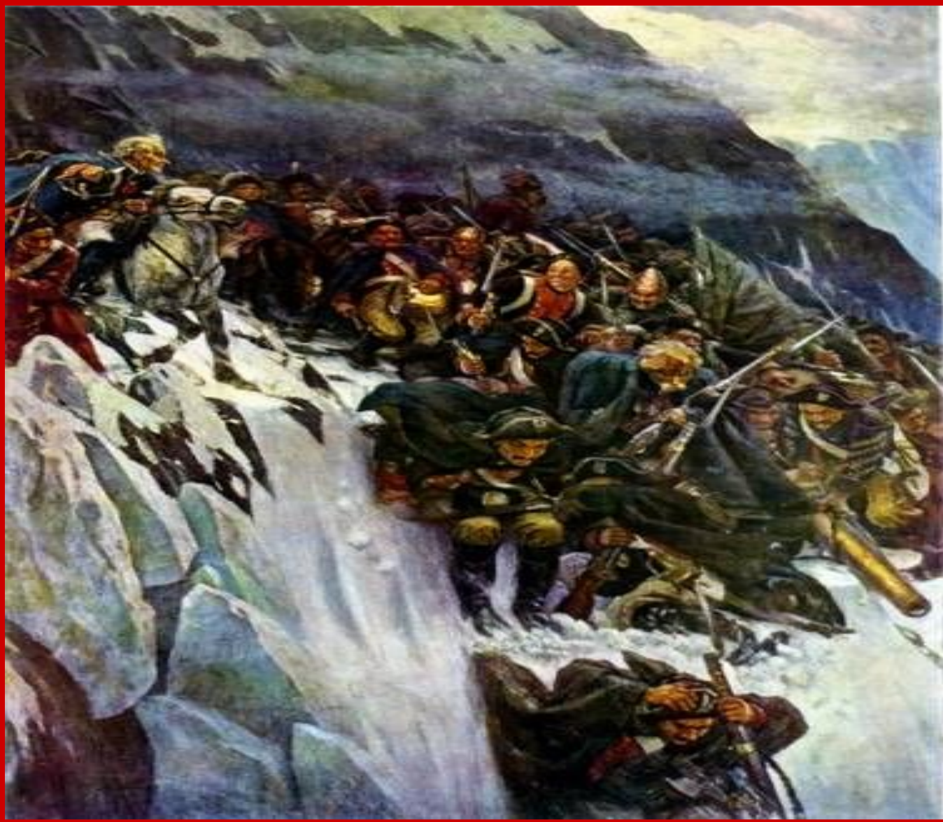
Переход А.В. Суворова через Альпы