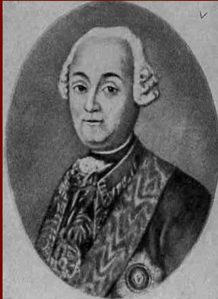
Василий Иванович Суворов (отец А.В. Суворова)