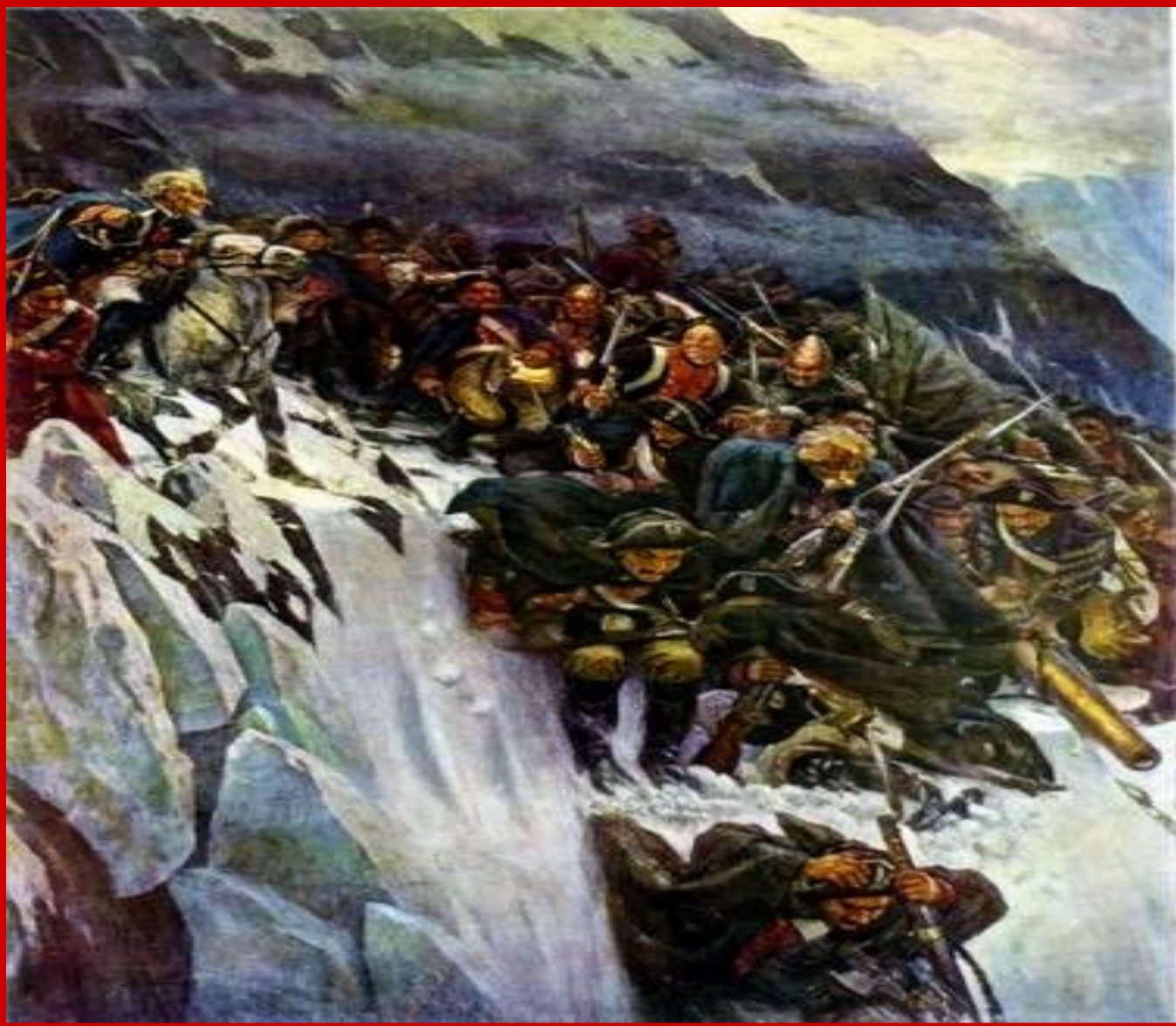
Переход А.В. Суворова через Альпы