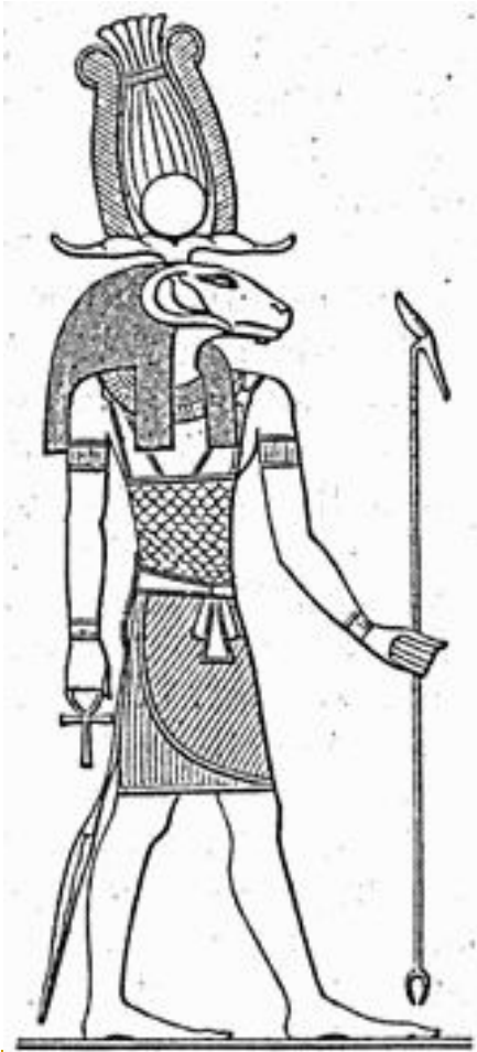
Хнум - творец