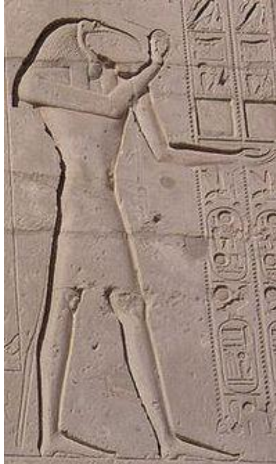
Тот – бог мудрости