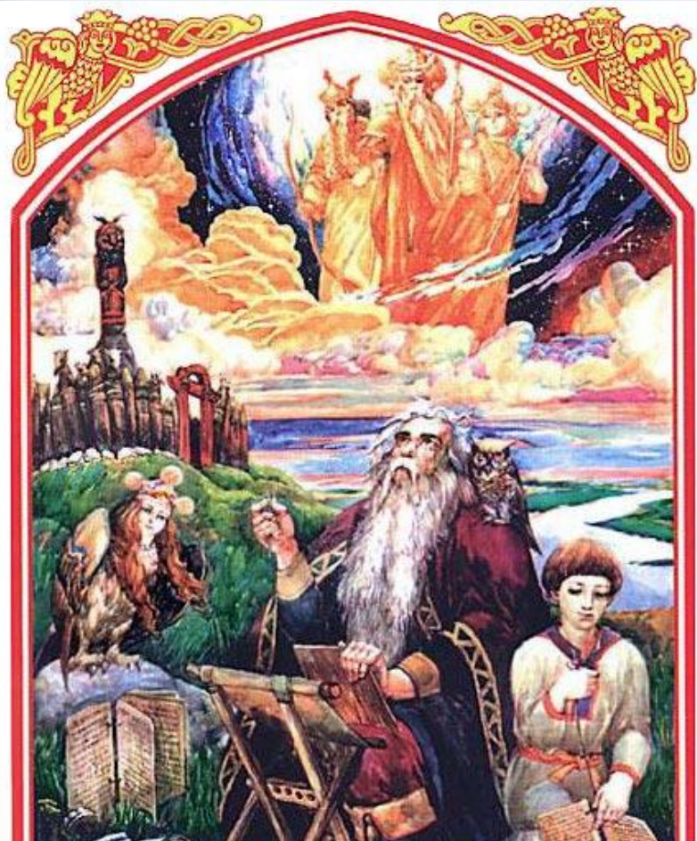
Велес – покровитель скота