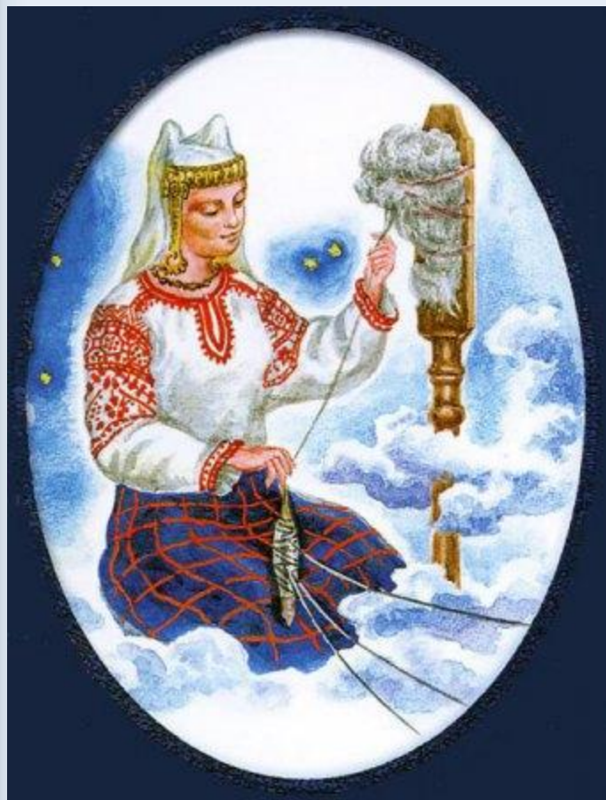
Мокошь ( Макошь)

Богиня в восточнославянской мифологии, единственное женское божество, идол которого стоял в воздвигнутом князем Владимиром киевском капище наравне с кумирами других богов