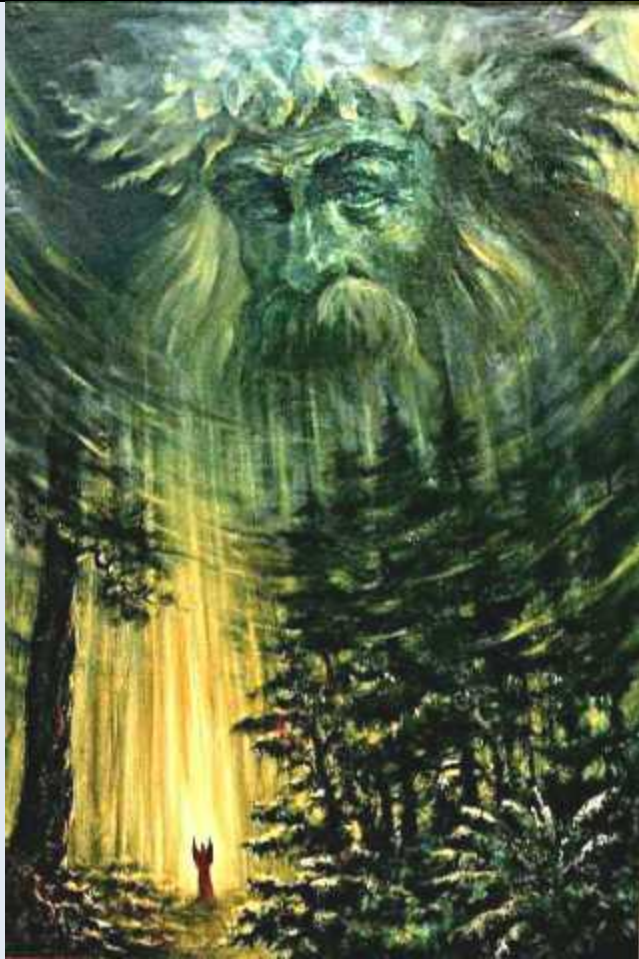
Велес – покровитель скота

Велес, Волос ) — божество в древнерусском языческом пантеоне, «скотий бог», покровитель сказителей и поэзии. С именем Велеса у славян связывалось звёздное скопление