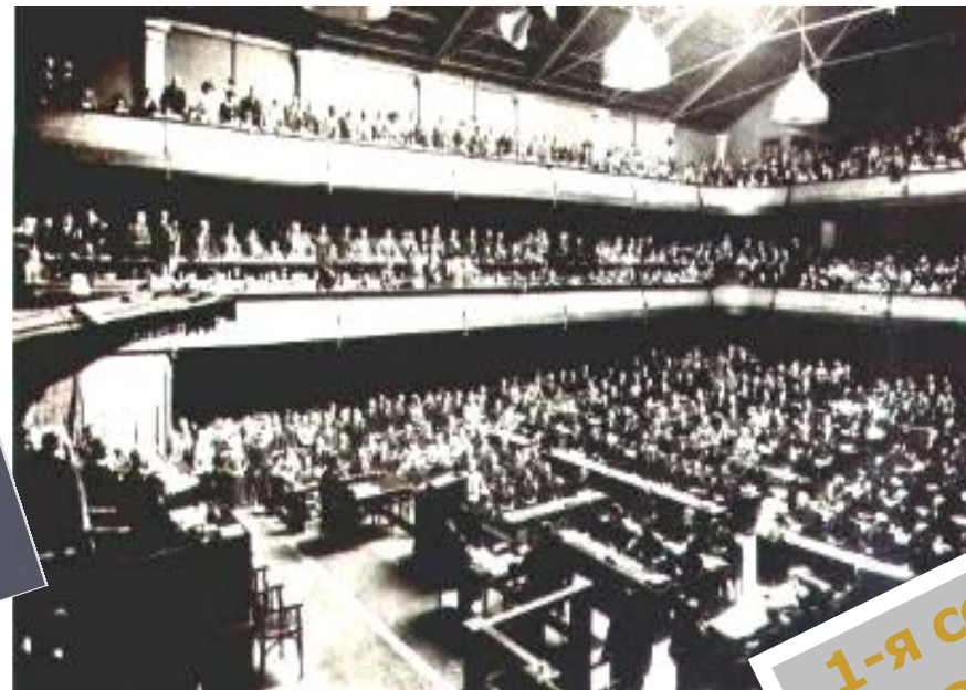
1-я сессия Ассамблеи Лиги Наций.