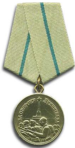
медаль «За оборону Ленинграда»