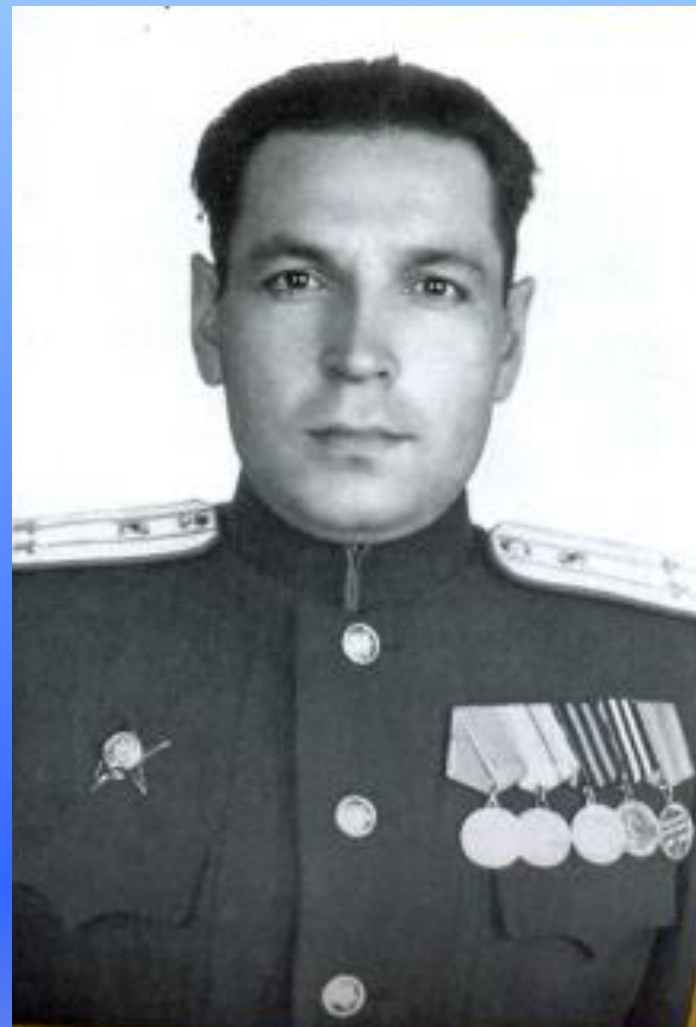
Заместитель командира полка г.Алитус, 1952 год