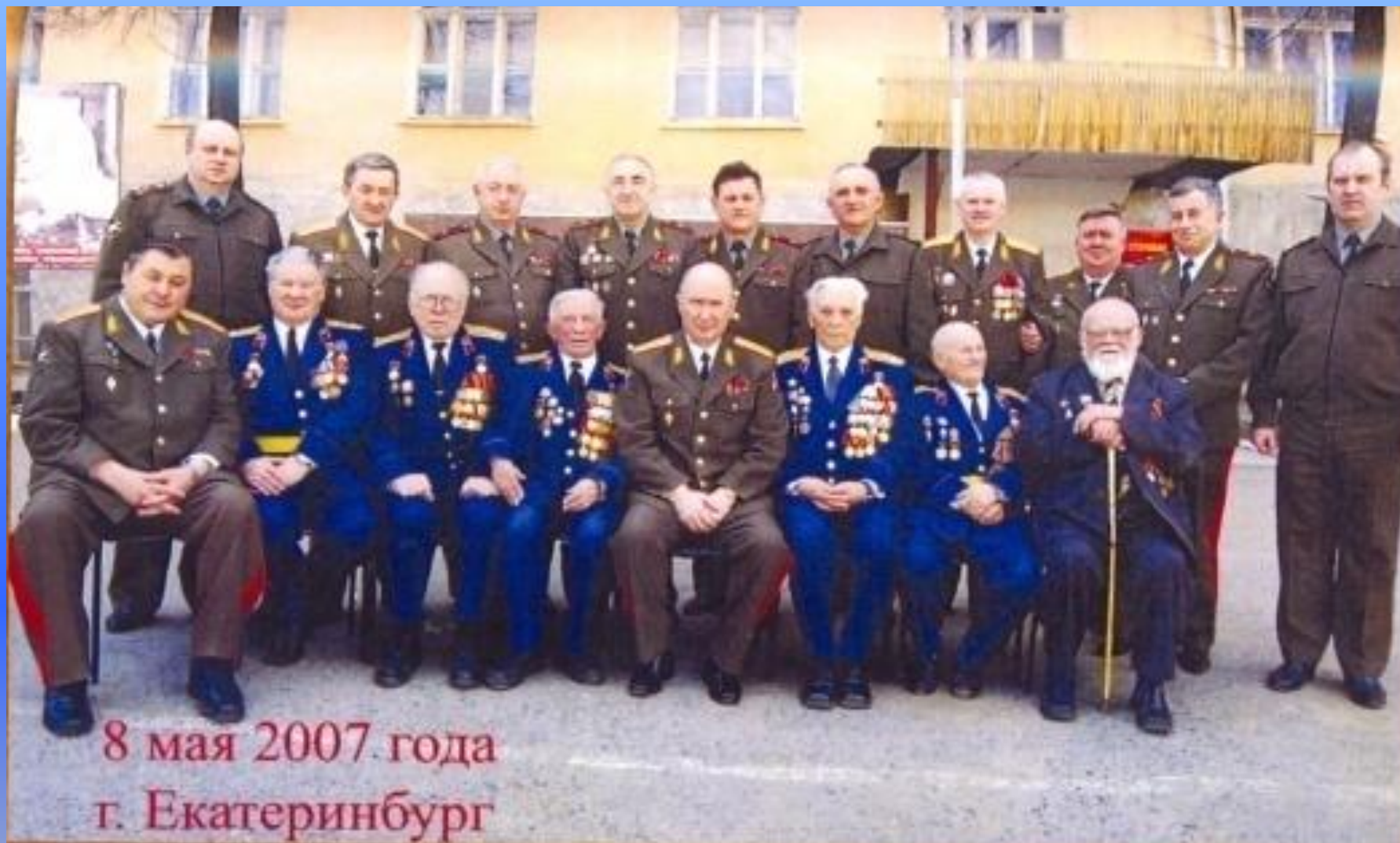
8 мая 2007. года г. Екатеринбург