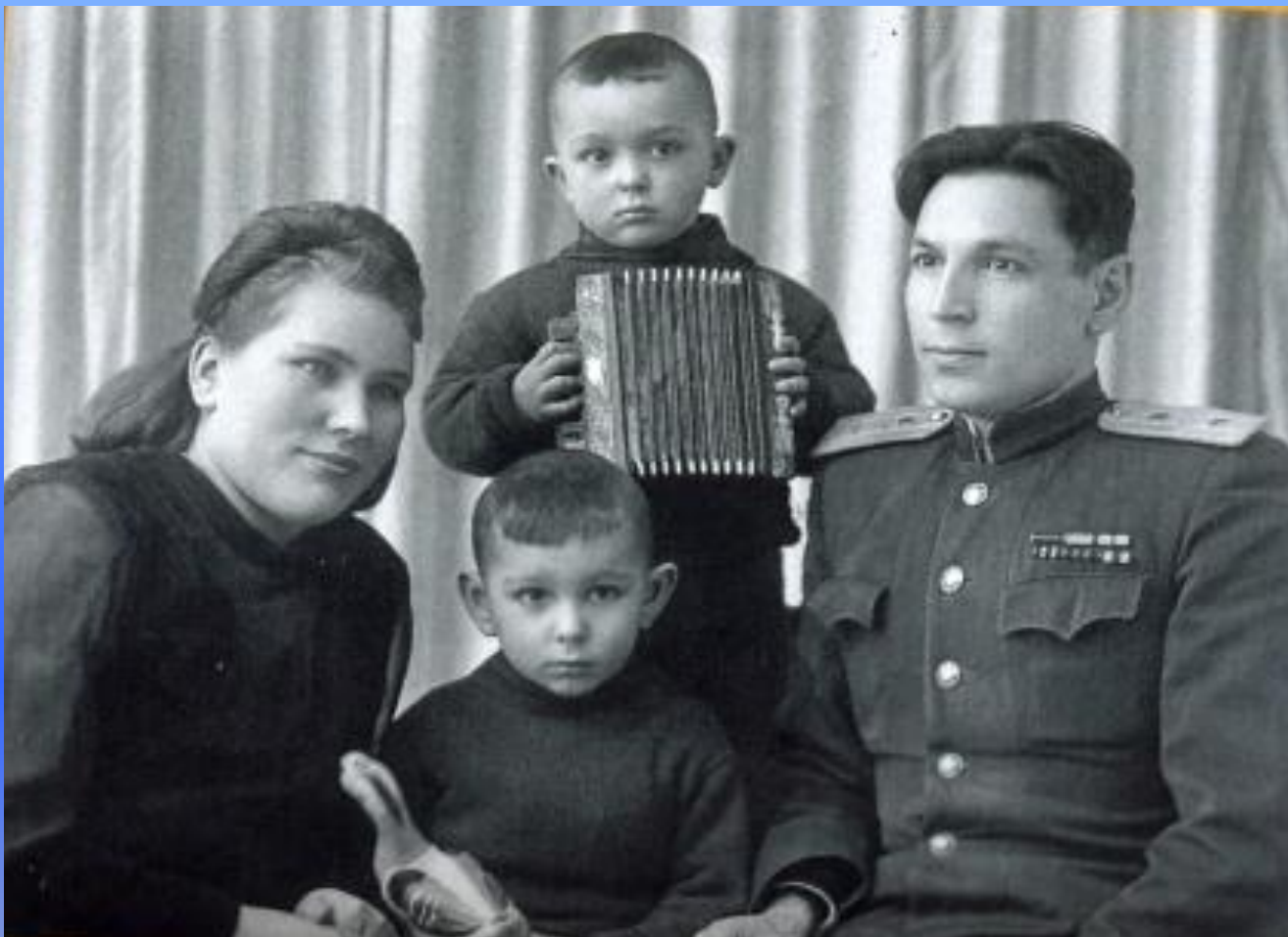
Слушатель военной академии. 1949 год.

В 1949 году поступил в военную Академию тыла в городе Калининe. В Академии получил звание – подполковник.