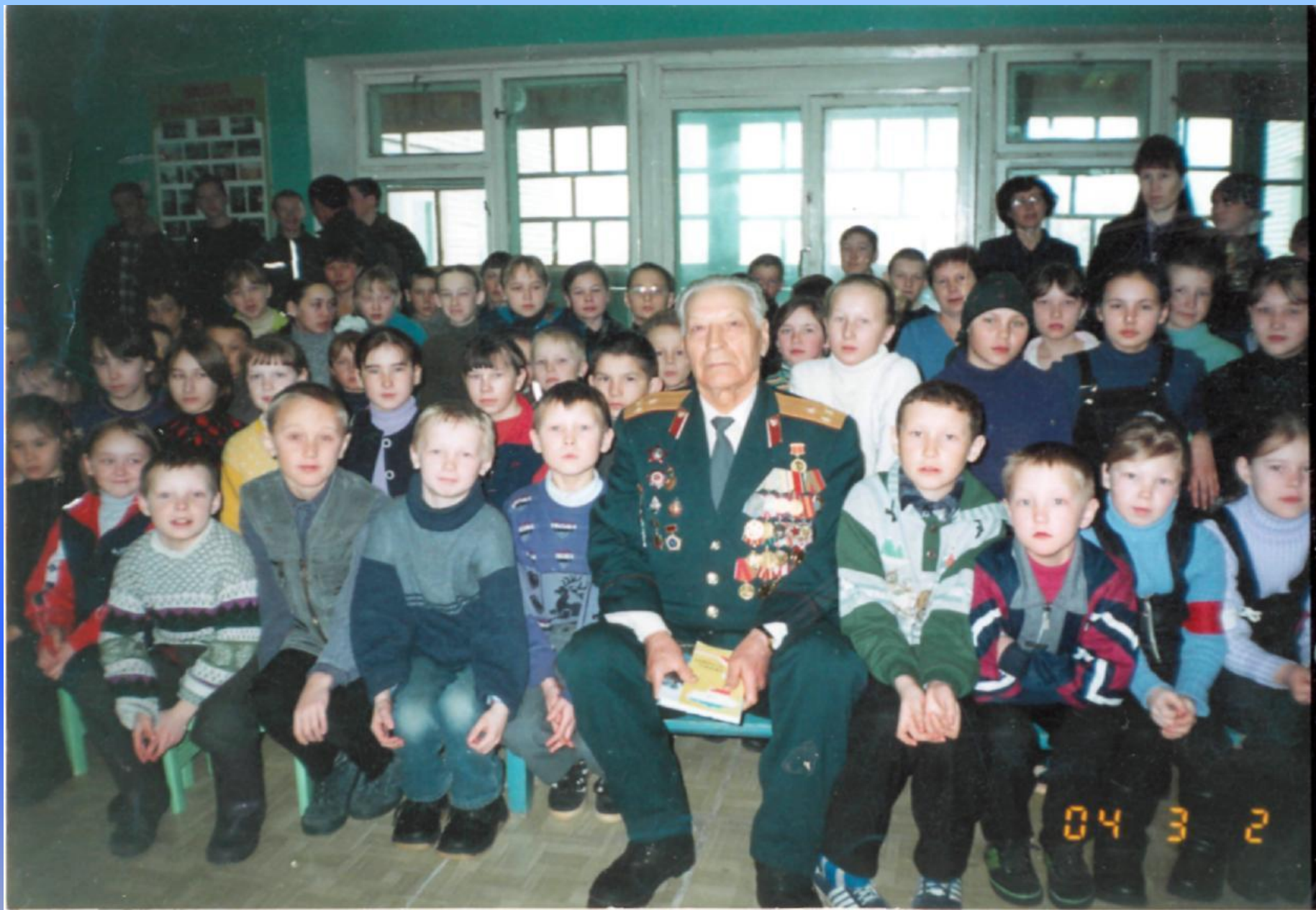
Среди учащихся Купсолинской школы, 2004 год.