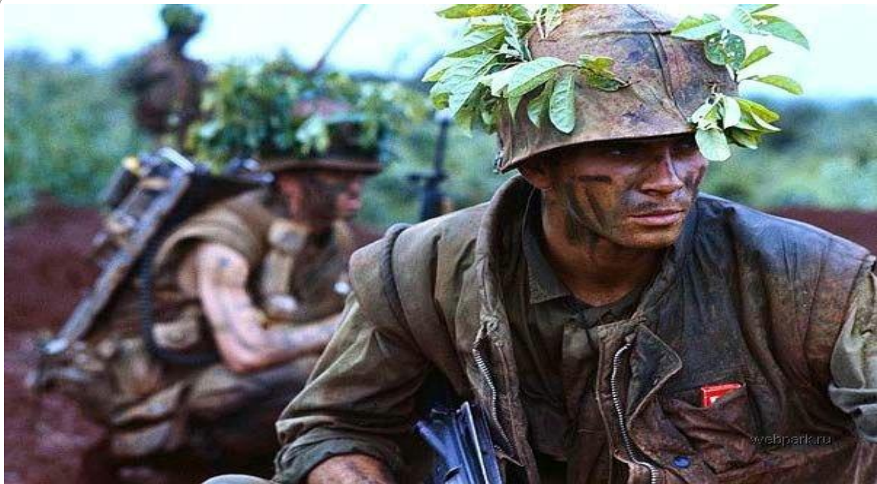
Морские пехотинцы в разведке. Демилитаризованная зона, февраль 1968 года