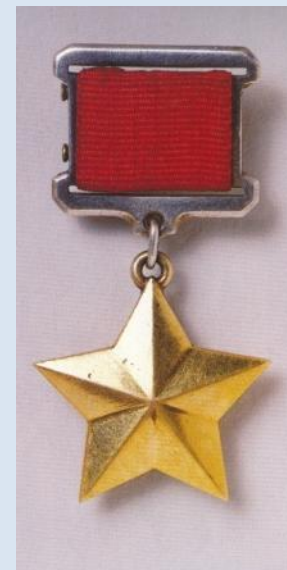
Герой Советского Союза Аскин Г.Г.