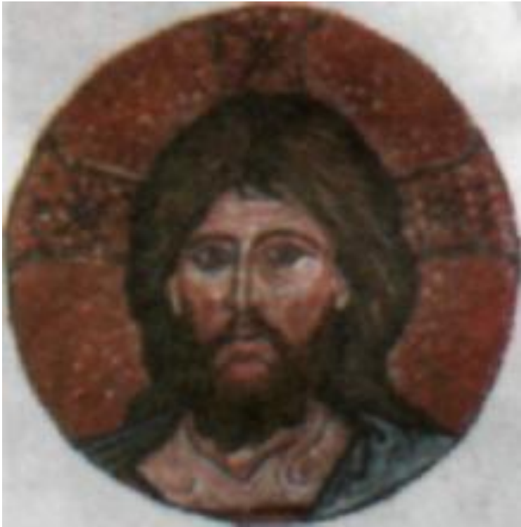
Портрет Ісуса — так Його зображали в перші століття після Розп'яття