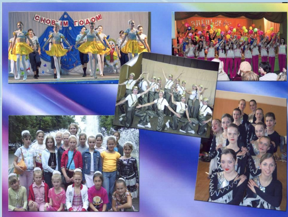
Народный хореографический коллектив "Эдельвейс"