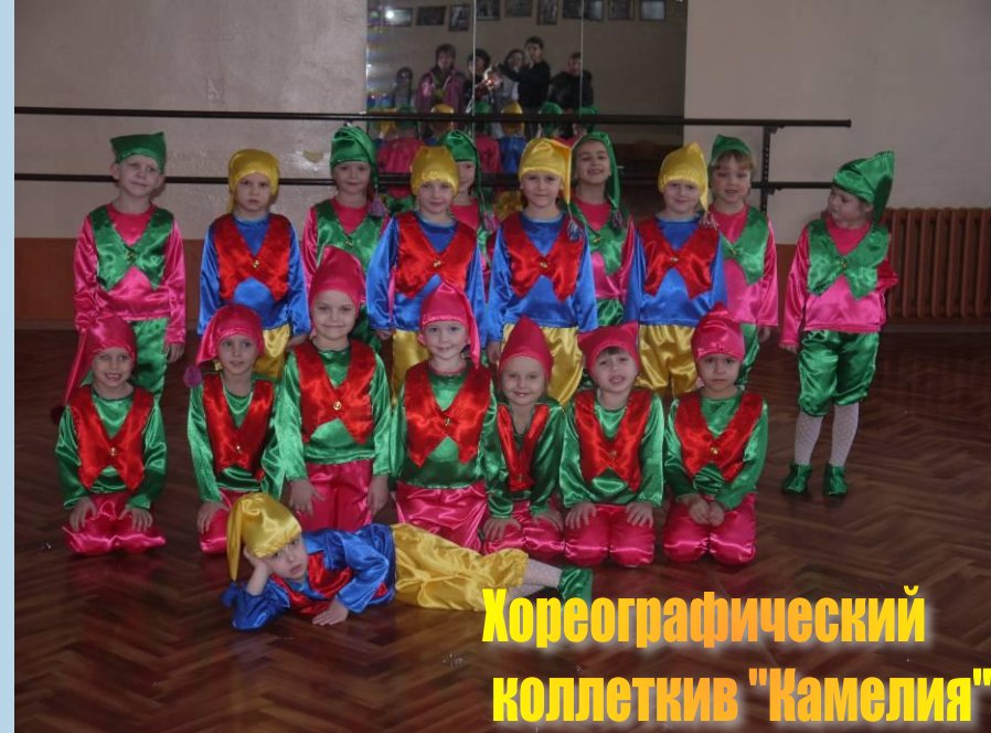
Хореографический коллектив "Камелия"